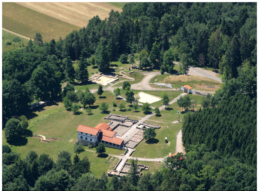
B1 Luftbild – Gesamtanlage des Freilichtmuseums

Weitere Tipps erhältst du bei Bedarf von deinem Lehrer!