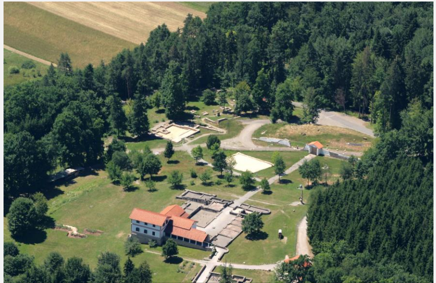
B 1 Luftbild – Gesamtanlage des Freilichtmuseums

Einen Tipp erhältst du bei Bedarf von deinem Lehrer!