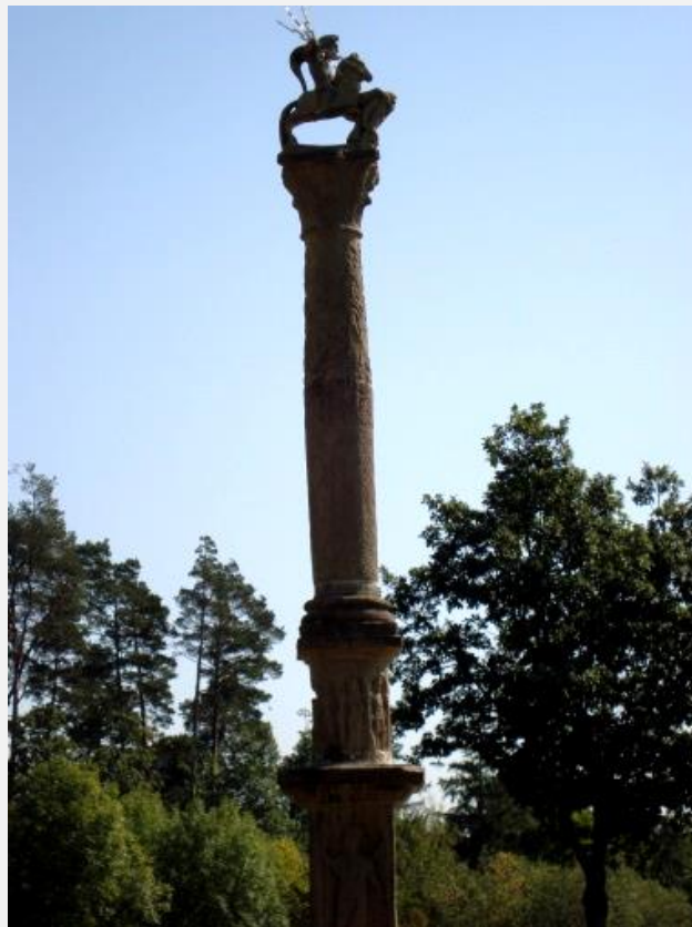
B 11 Rekonstruktion einer Jupitergigantensäule © Christa Landwehr