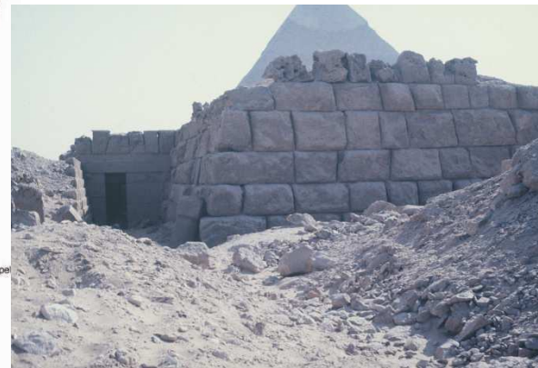
B 5 Blick von Norden auf die Mastaba Seschemnefers III., im Hintergrund die Chephren-Pyramide B 36 Die vor Ort verbliebenen Teile der Mastaba