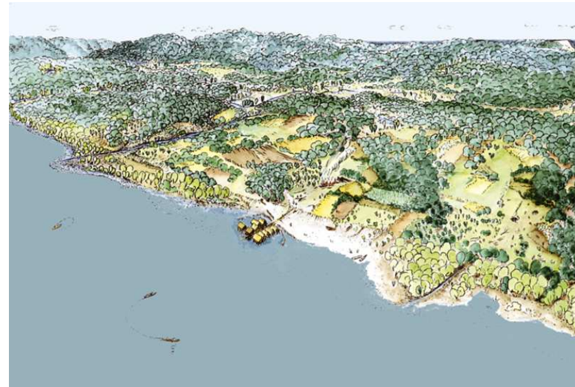
M2: Rekonstruktion eines Pfahlbaudorfes bei Allensbach am Bodensee.