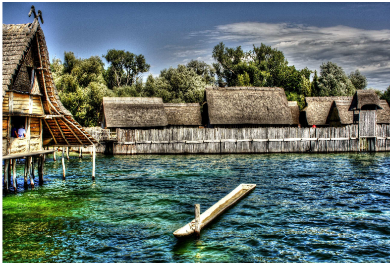
M3: Rekonstruiertes Pfahlbaudorf am Bodensee (© wikicommons, Heribert Pohl).