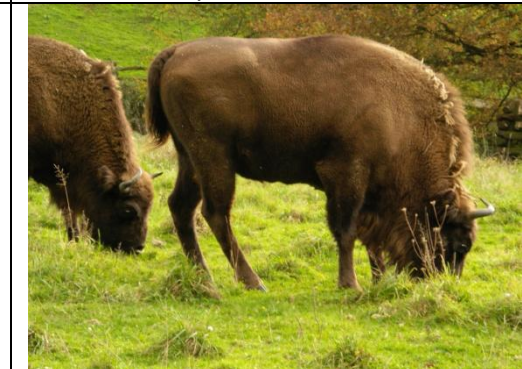
8: Wisente (europäische Bisons)

Bildnachweis: 1 © Wikipedia, Sémhur, https://commons.wikimedia.org/wiki/File:Reconstitution_d%27un_lion_des_cavernes.jpg?uselang=de , 2 © Wikipedia, Bogomolov.PL, https://commons.wikimedia.org/wiki/File:Ursus_spelaeus_Sergiodlarosa.jpg?uselang=de , 3 © Wikipedia, Jugatsumikka, https://commons.wikimedia.org/wiki/File:Mammoth.png , 4 © Wikipedia, Flickruploadbot, https://commons.wikimedia.org/wiki/File:Grazend_Bees.jpg?uselang=de , 5 © Michael Gäbler, https://commons.wikimedia.org/wiki/File:Erinaceus_europaeus_(Linnaeus,_1758).jpg , 6 © Wikipedia, Gdr, https://commons.wikimedia.org/wiki/File:Polymixia_nobilis.jpg?uselang=de , 7 © Wikipedia, File Upload Bot (Magnus Manske), https://commons.wikimedia.org/wiki/File:SkimmerSkimming.JPG , 8 © Wikipedia, File Upload Bot (Magnus Manske), https://commons.wikimedia.org/wiki/File:Neandertal_-_Wisent.jpg