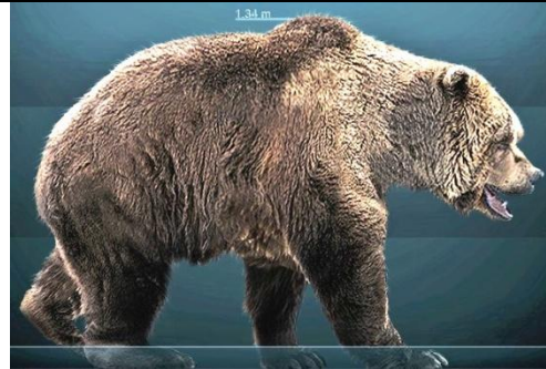
2: Rekonstruktion eines Höhlenbären