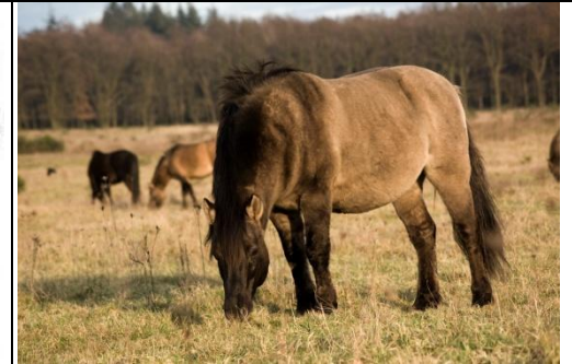
4: Koniks sind eine Pferderasse aus Osteuropa, die viel Ähnlichkeit mit eiszeitlichen Wildpferden hat.