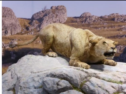
1: Rekonstruktion eines europäischen Höhlenlöwen