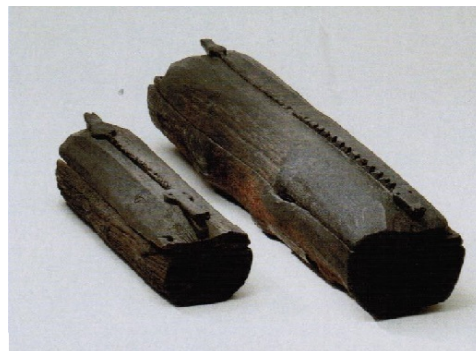
B5: Baumsärge, die in Oberflacht gefunden wurden, links ein Kindersarg, aus: Ade, D., Rüth, B., Zekorn, A., Alamannen zwischen Schwarzwald, Neckar und Donau , Stuttgart, 2008, S. 113.

Informationen nach: Ade, D., Rüth, B., Zekorn, A., Alamannen zwischen Schwarzwald, Neckar und Donau , Stuttgart, 2008, S. 113.