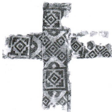
B13: Reste eines aufgenähten, zweiteiligen Seidenkreuzes, aus: Ade, D., Rüth, B., Zekorn, A., Alamannen zwischen Schwarzwald, Neckar und Donau , Stuttgart, 2008, S. 141.