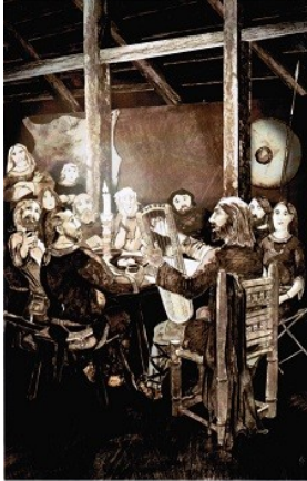
B18 Zeichnung: Lebensbild – Leierspieler beim Gastmahl Zeichnung: Christina von Elm. Die Zeichnerin