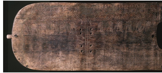
B1: Leier aus Grab 58 von Trossingen, Detail Vorderseite