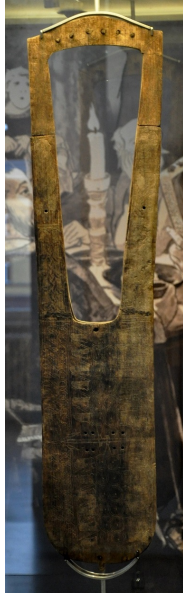
B 12: Trossinger Leier, Archäologisches Landesmuseum Baden-Württemberg, Konstanz, aus: Wikimedia Commons © gemeinfrei