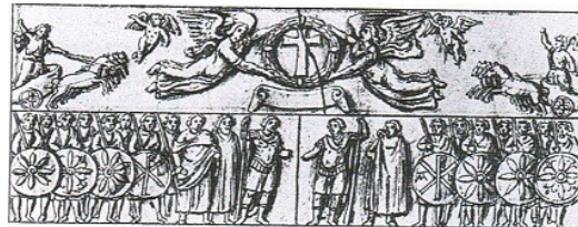
B16: Das ist eine Szene vom Sockel der Arcadiusssäule in Konstantinopel (um 400 n. Chr.). In der Mitte stehen sich die Kaiser Arcadius und Honorius mit ihrer jeweiligen Garde gegenüber.