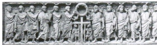
B17: Diese Szene ist auf einem stadtrömischen Sarg des späten 4. bzw. 5. Jahrhunderts zu sehen. In der Mitte ist Christus durch das Kreuz symbolisiert. Rechts und links sind die zwölf Apostel* dargestellt. © Brenk, B., Spätantike und frühes Christentum. Propyläen Kunstgeschichte. Supplementband 15 (Frankfurt a. M., Berlin 1977), Taf. 79 a.