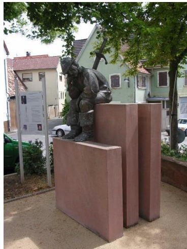
Denkmal bei Nußdorf.

Mögliche Varianten eines Denkmals für den Bauernkrieg