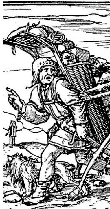
Hans Holbein d. J., Krämer, Holzschnitt um 1525 (Ausschnitt)

„Schorndorf mit seinen fast 2500 Einwohnern ist eine wohlhabende Stadt im Herzogtum Württemberg. Die Handelsstadt lebt vor allem vom Wein- und Salzhandel. Und wo es Märkte gibt, da gibt's für mich auch was zu verdienen. Die Schorndorfer haben gerade eine neue Stadtkirche gebaut. Natürlich schön groß und schön teuer. Geldspenden aus dem Ablasshandel bringen ja einiges ein. Feine Christen sind das! Die glauben, dass sie für Geld ihre Zeit im Fegefeuer verkürzen können. Schorndorf ist auch eine unruhige Stadt. Vor 10 Jahren war sie die Hauptstadt des Aufstands „Armer Konrad“! Die Untertanen wehrten sich in ihrer Not gegen den verhassten Herzog Ulrich. So was hat es vorher nicht gegeben! Der Herzog ließ daraufhin 10 Anführer des Aufstands vor den Toren Schorndorfs unbarmerzig hinrichten. Na ja, fünf Jahre später – anno 1519 – hat der Schwäbische Bund diesen Verschwender, Betrüger und Mörder nach seinem Überfall auf die freie Reichsstadt Reutlingen aus seinem Land vertrieben! Danach hat Kaiser Karl V. die österreichischen Habsburger in Württemberg eingesetzt. Die kann aber auch niemand leiden. Die unterdrücken jeden, der gegen die katholische Kirche und den Papst ist. Zum Glück gibt es den Martin Luther, der sich von Papst, Kirche und Kaiser nichts gefallen lässt. Da bricht einiges auf in dieser Zeit. Freiheit ist in der Luft, die Freiheit eines Christenmenschen. Wenn die wüssten, was ich alles bei mir habe ...“