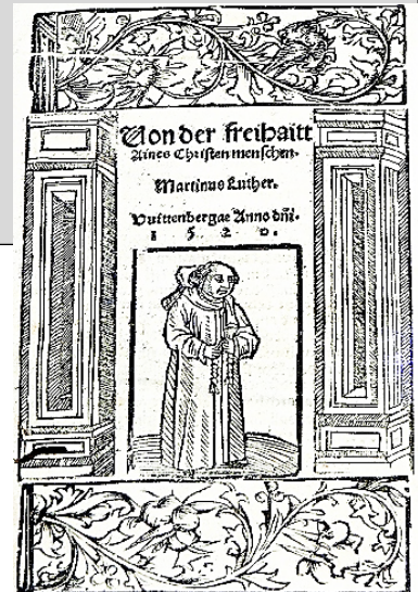
Martin Luther, 1520 Von der Freihait Aines Christenmenschen