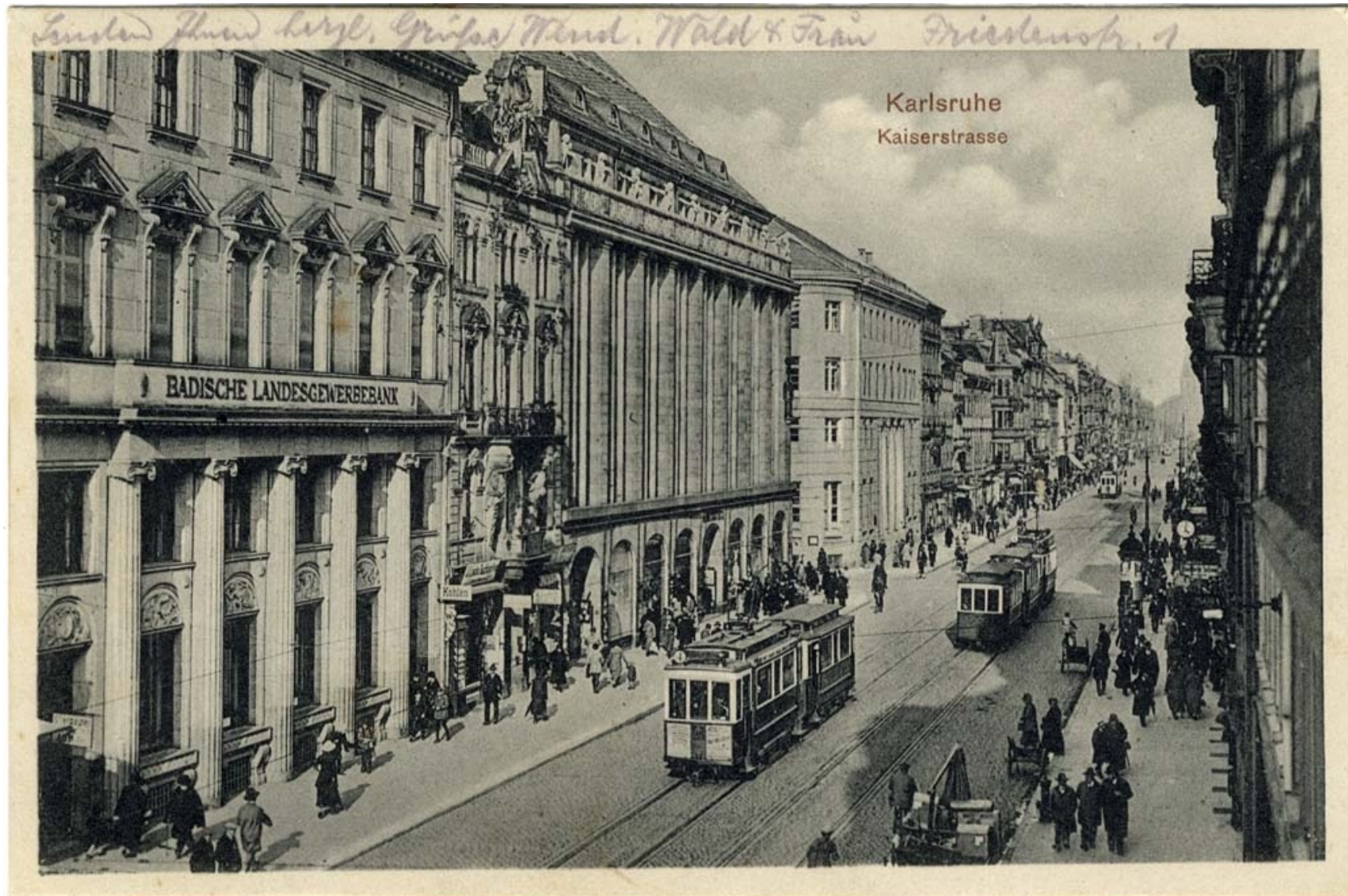
Badische Landesgewerbebank und rechts davon das Warenhaus Tietz, um 1926.

© Stadtarchiv Karlsruhe; StAK 8/PBS oXIIIb 798