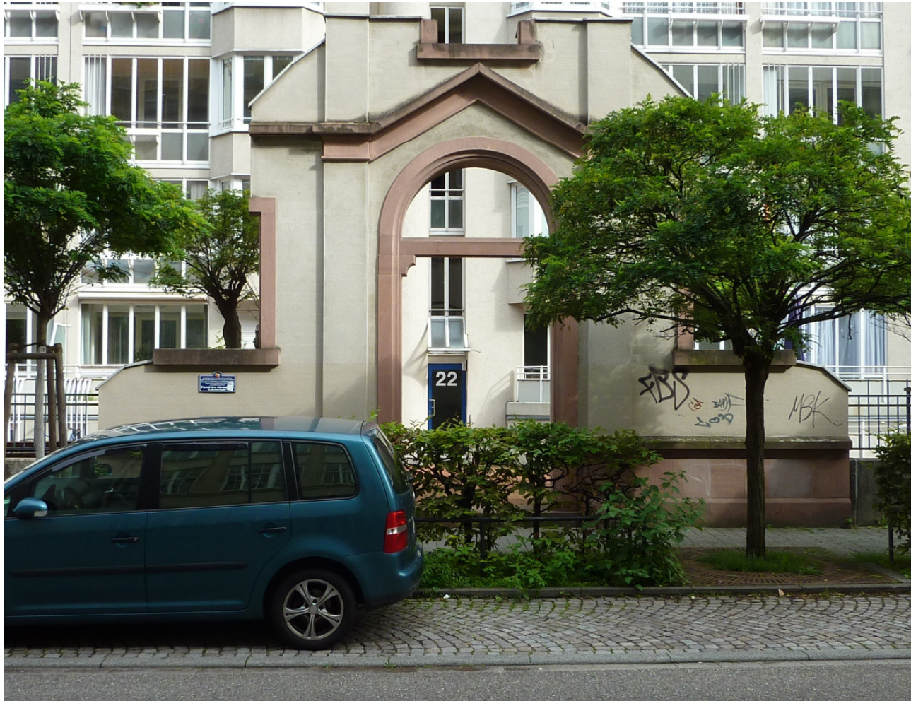
Portal der ehemaligen Lidellschule; erhalten ist nur das Eingangsportal; links die Gedenktafel.