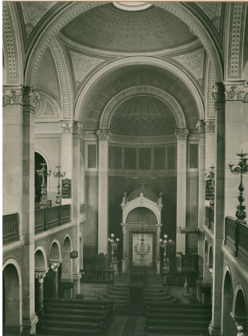
Das Innere der jüdischen Synagoge in der Kronenstraße; Fotografie aus dem Jahr 1896. © Landesarchiv Baden-Württemberg, Generallandearchiv Karlsruhe; GLA 69 Baden, Sammlung 1995, F I Nr. 535