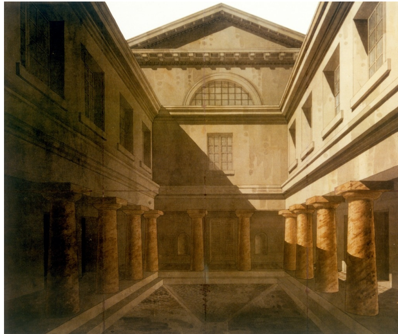
Karlsruher Synagoge in der Kronenstraße, Hofansicht. Lithografie um 1830.