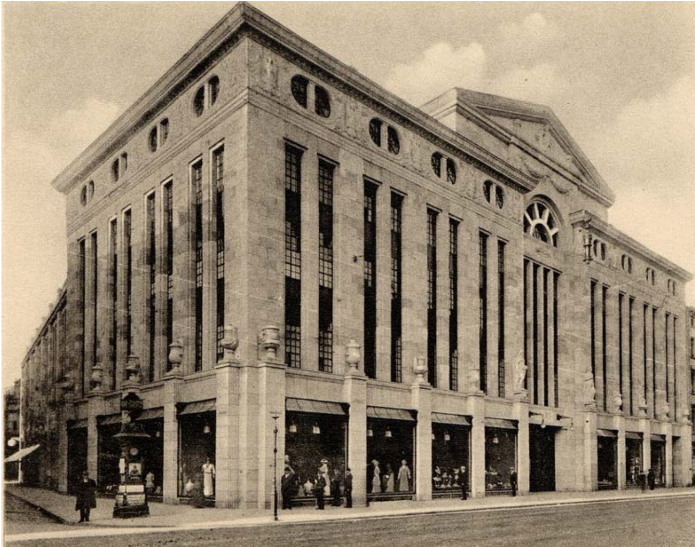
Warenhaus Geschwister Knopf in Karlsruhe, 1914.

© Stadtarchiv Karlsruhe; StAK 8/PBS oXIVE 191