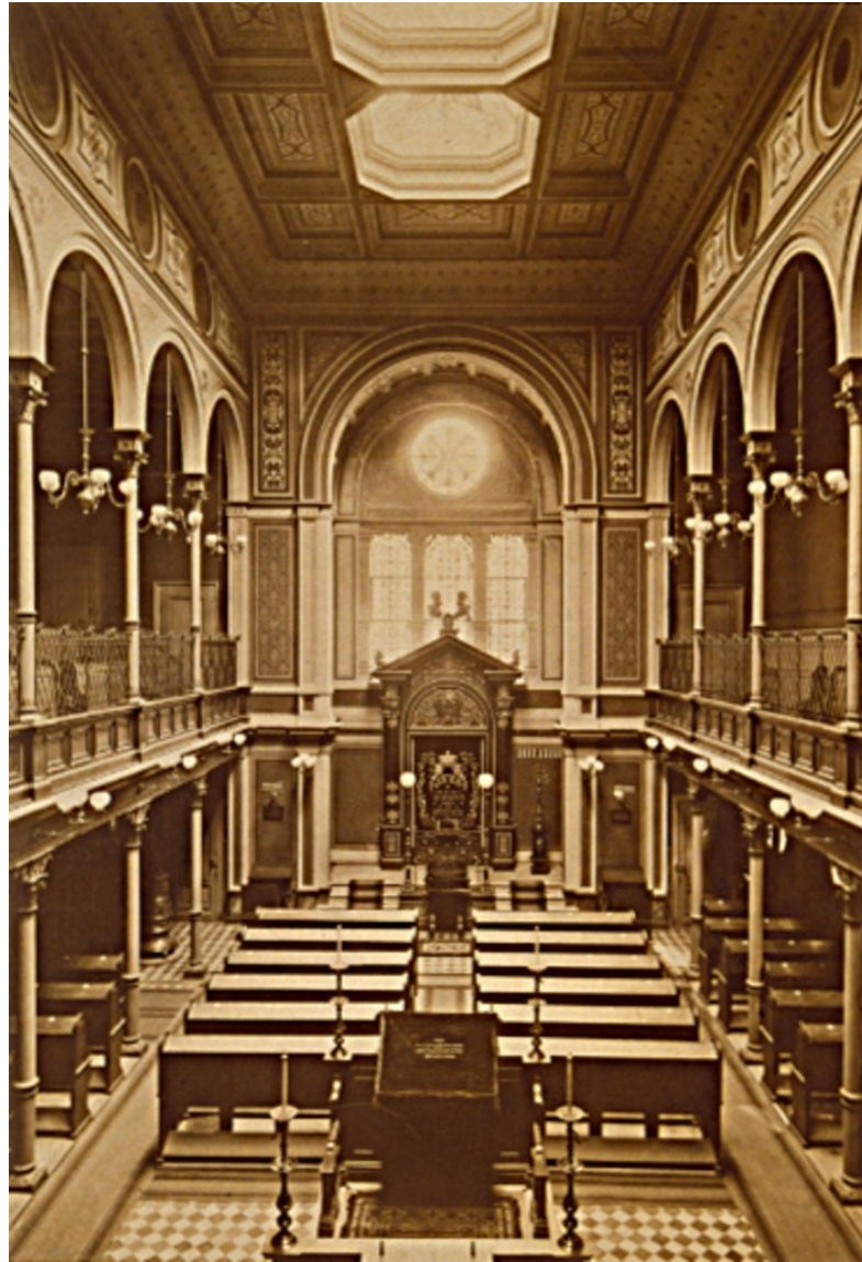
Inneres der orthodoxen Synagoge Karlsruhe, Postkarte aus dem Jahr 1881.

© Stadtarchiv Karlsruhe; StAK Historische Postkarten 8/PBS oXIVc 246