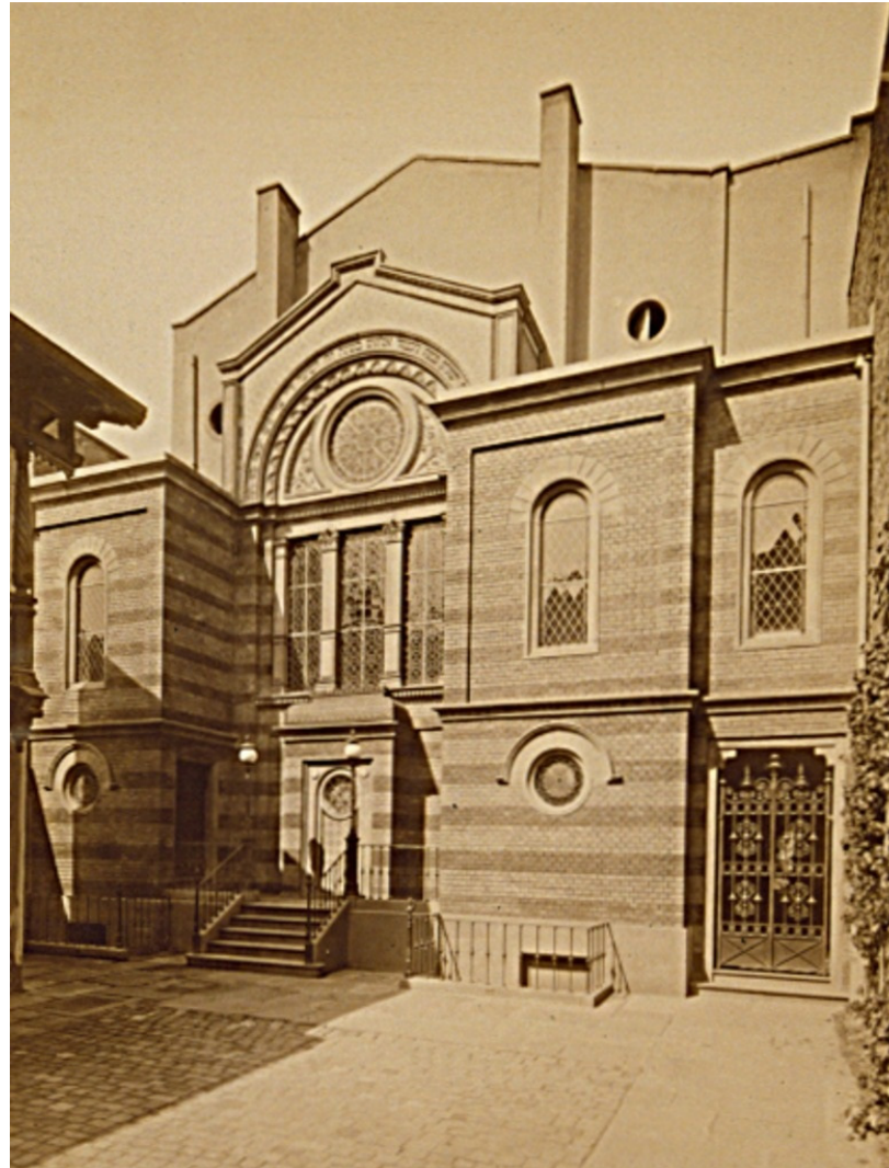
Orthodoxe Synagoge in der Karl-Friedrich-Straße, um 1900.