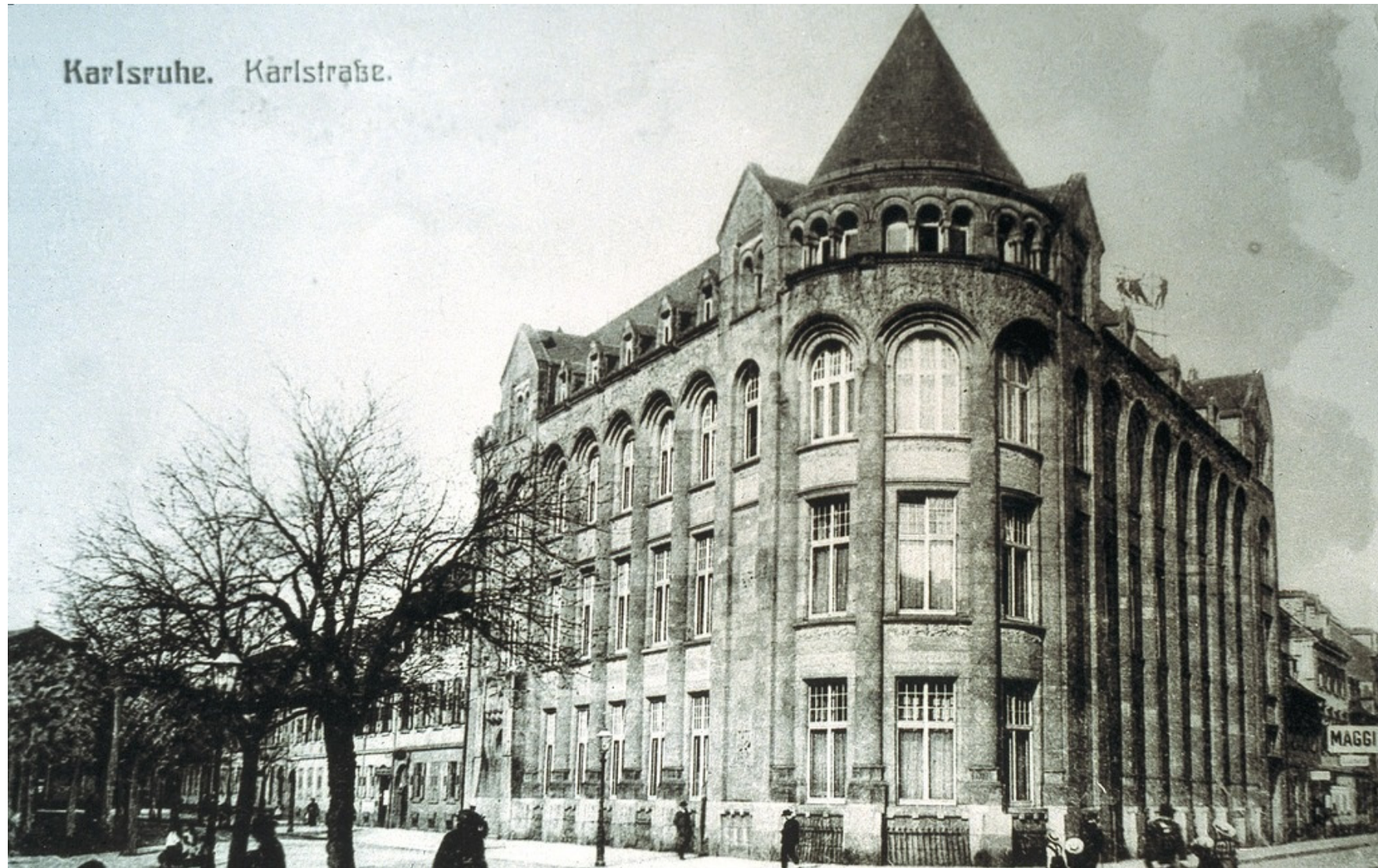
Ansicht des Bankhauses Veit L. Homburger, um 1910.