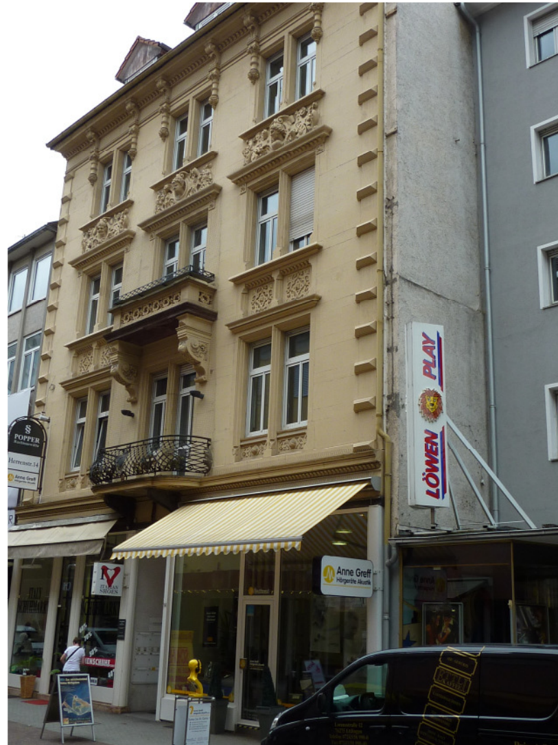
Vorderfront des ehemaligen Gemeindezentrums, Herrenstr. 14 ©Rainer Henndl