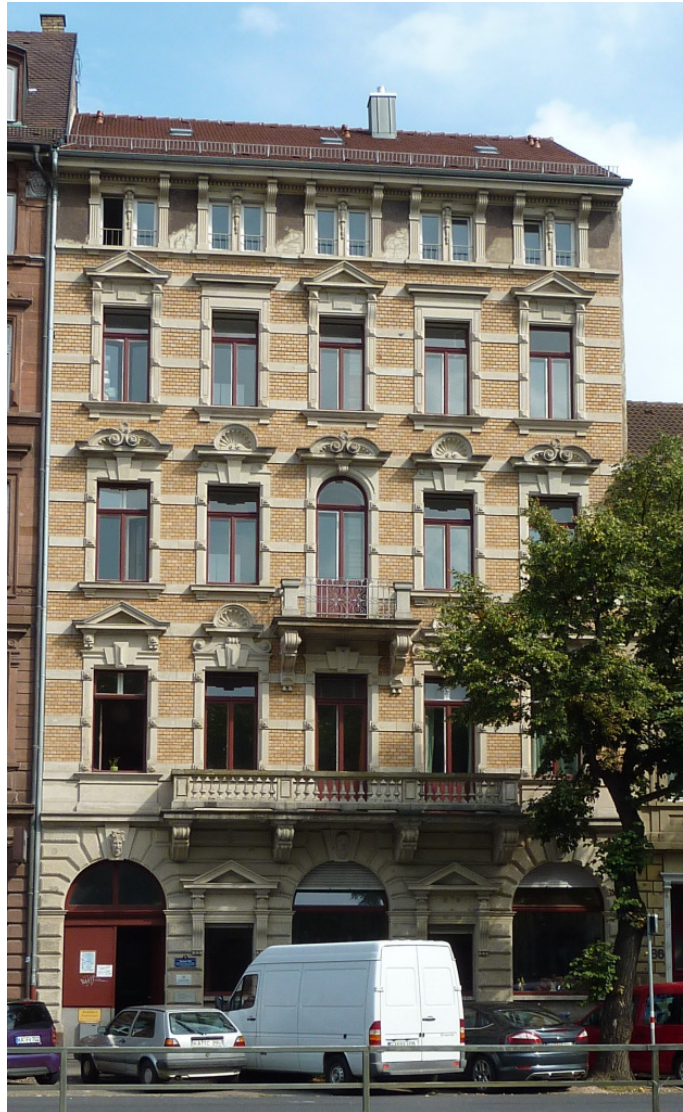
Das ehemalige Hotel Nassauer Hof