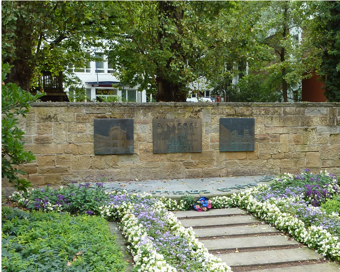
Ehemalige Synagoge in der Kronenstraße 17, heutige Gedenkstätte.