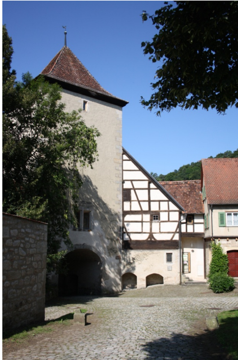
B 16