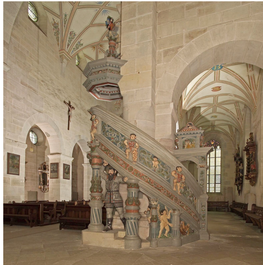
B 11