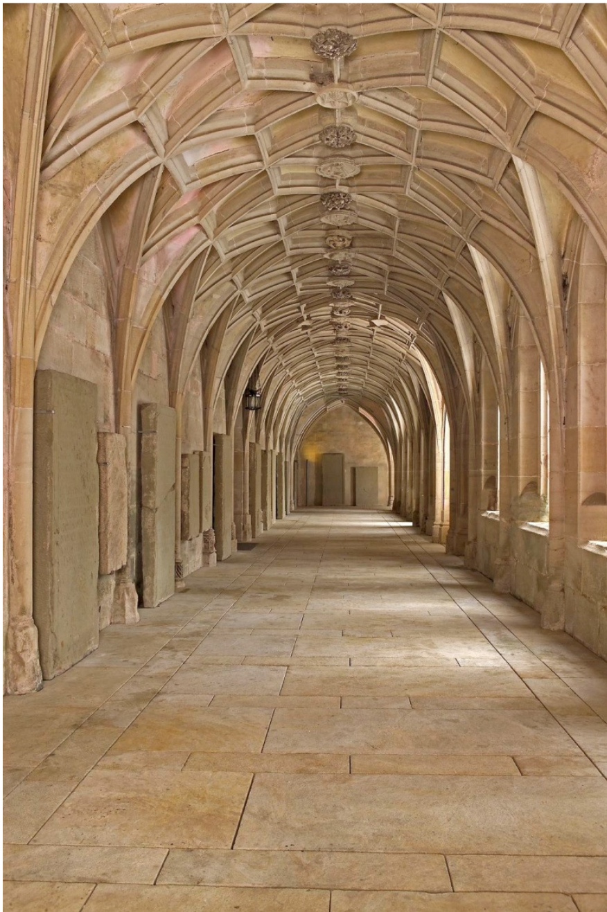
B 15