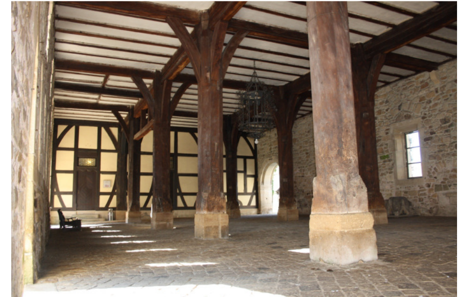
B 19