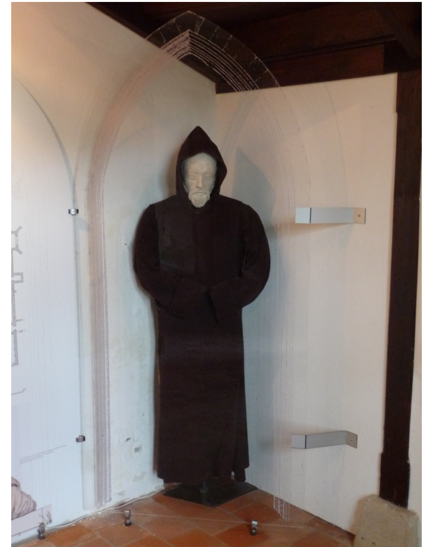
B 18 © Dieter Grupp