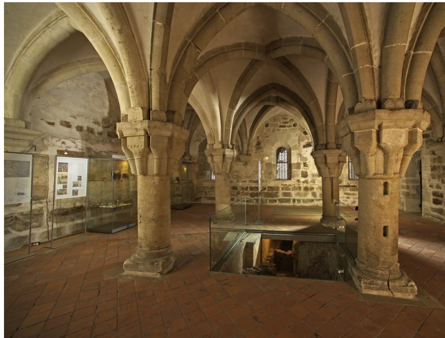
B 17