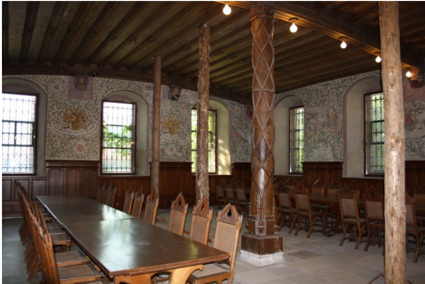
B 20