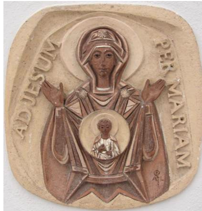
2 Darstellung von Maria (groß) und Jesus; Inschrift „Ad Jesum per Mariam“ = „Mit Hilfe von Maria zu Jesus“; Maria wird in der Abtei Lichtenthal besonders verehrt; der Überlieferung nach hat sie das Kloster mehrfach gerettet.