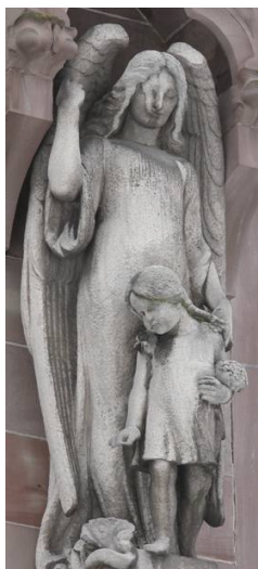
6 Schutzengel mit kleinem Mädchen