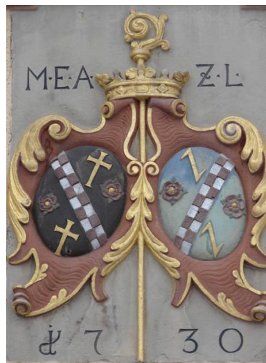
8 Sammelwappen: Rosen und Kreuze = Wappen der Äbtissin, Flößerhaken und rot-weiß kariertes Querstreifen: siehe oben (anderes Sammelwappen); „MEAZL“ steht für „M(aria) E(uphrosina) A(ebtissin) z(u) L(ichtenthal)“; im Jahre „1730“ wurde das Gebäude errichtet.