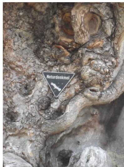
7 ??? (... musst du selbst herausfinden!)