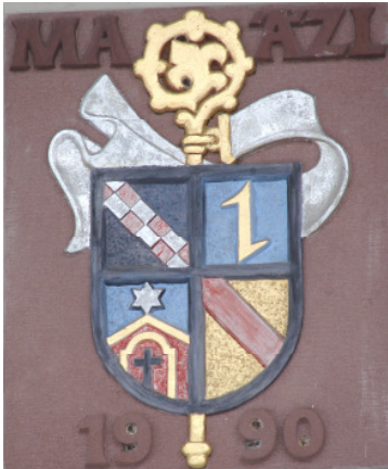
1 Sammelwappen mit Äbtissinnenstab und vier Feldern (von links oben im Uhrzeigersinn: Wappen Bernhards von Clairvaux, des Klosters Lichtenthals, Badens, der Äbtissin); „MAAZL“ steht für „M(aria) A(delgundis) A(ebtissin) z(u) L(ichtenthal)“; 1990 wurde der Umbau der ehemaligen Wirtschaftsgebäude zu Gästehäusern abgeschlossen.

Suche die neun Bildmotive! Für ein Motiv musst du das Klostergelände sogar verlassen. Markiere den jeweiligen Fundort exakt im Klostergrundriss auf der Rückseite, indem du dort die richtige Zahl einträgst.