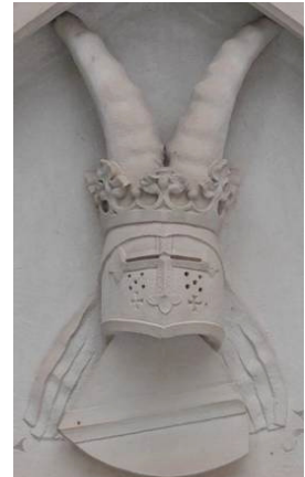
3 Wappen der Markgrafen von Baden: Schild mit (rotem) Querbalken auf (goldenen) Grund und Helmzier: gekrönter Helm mit Steinbockhörnern