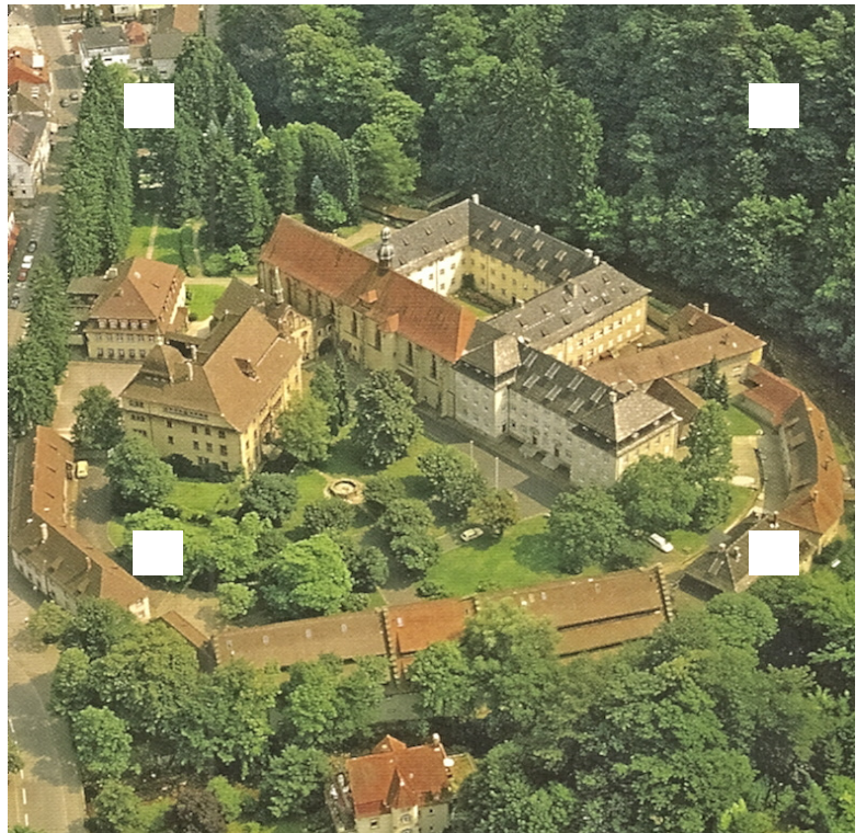
Luftaufnahme der Abtei Lichtenthal (1994)