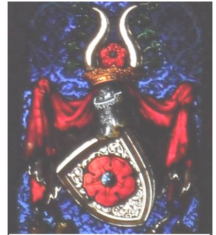
Farbig in leuchtendem Rot und Blau fast Angst einflößend: Wappen eines badischen Markgrafen, zu finden in der Lichtenthaler Fürstenkapelle.

Für ein Kirchenfenster müssen also hunderte, oft tausende Glasstücke exakt ausgeschnitten, dann bemalt und schließlich wie bei einem Puzzle zusammengesetzt werden. Du kannst dir sicher vorstellen, wieviel Arbeit in jedem Fenster steckt!