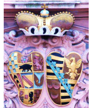
Detailaufnahme Schlosskirche: das Allianzwappen der Herrscherhäuser Baden-Baden und Sachsen-Lauenburg.