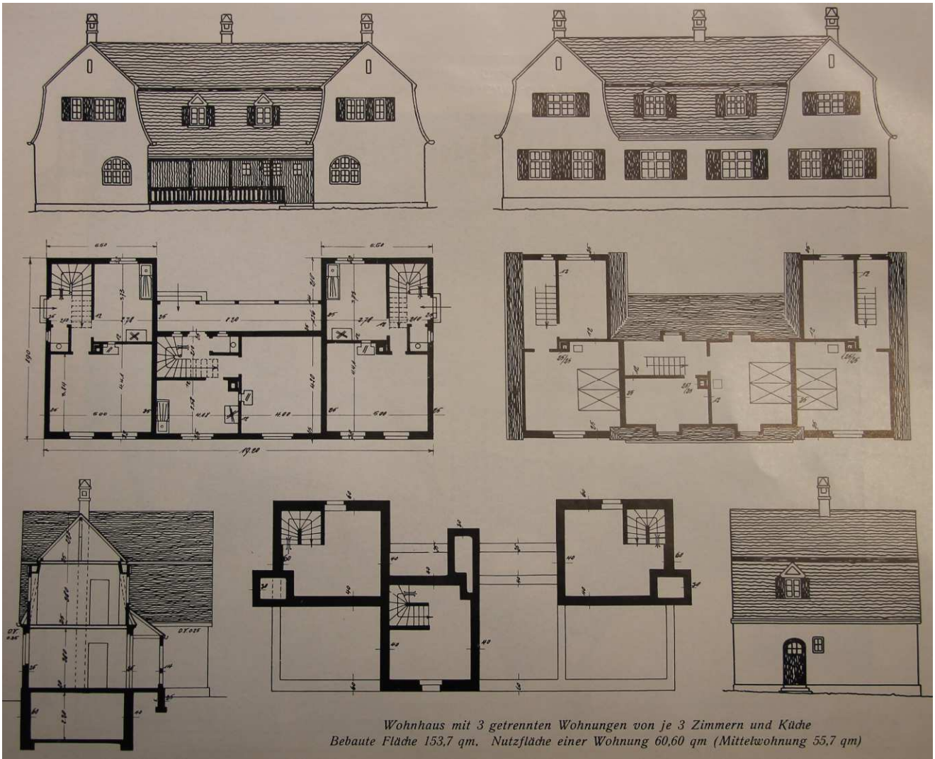
Wohnhaus mit 3 getrennten Wohnungen von je 3 Zimmern und Küche Bebaute Fläche 153,7 qm, Nutzfläche einer Wohnung 60,60 qm (Mittelwohnung 55,7 qm)