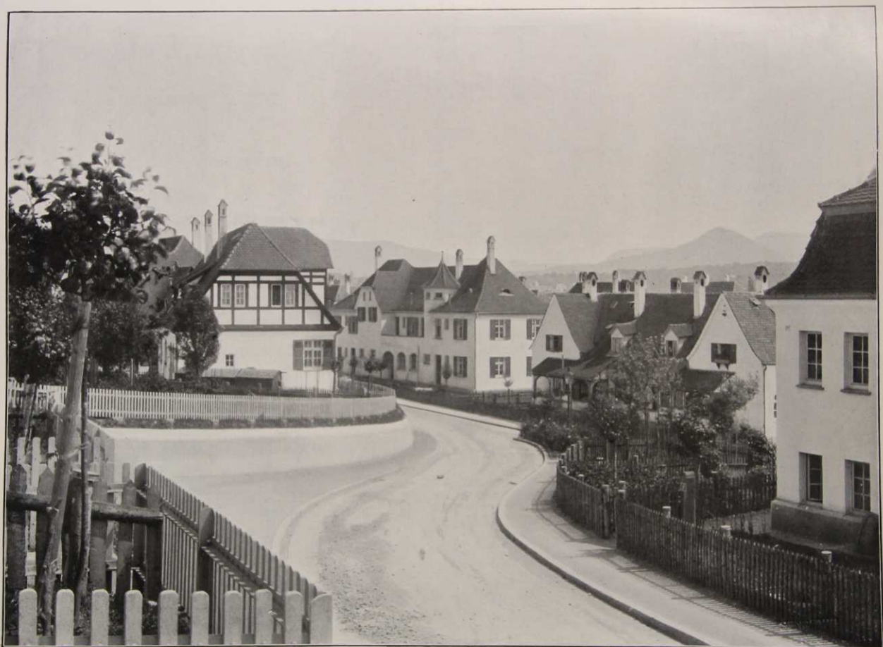
PROF. THEODOR FISCHER-STUTT GART Arbeiterkolonie Gmindersdorf von links nach rechts: Häusertypen 2, 7, 10