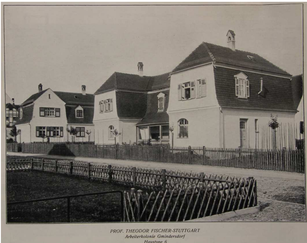
PROF. THEODOR FISCHER-STUTTART Arbeiterkolonie Gmindersdorf Haustype 6