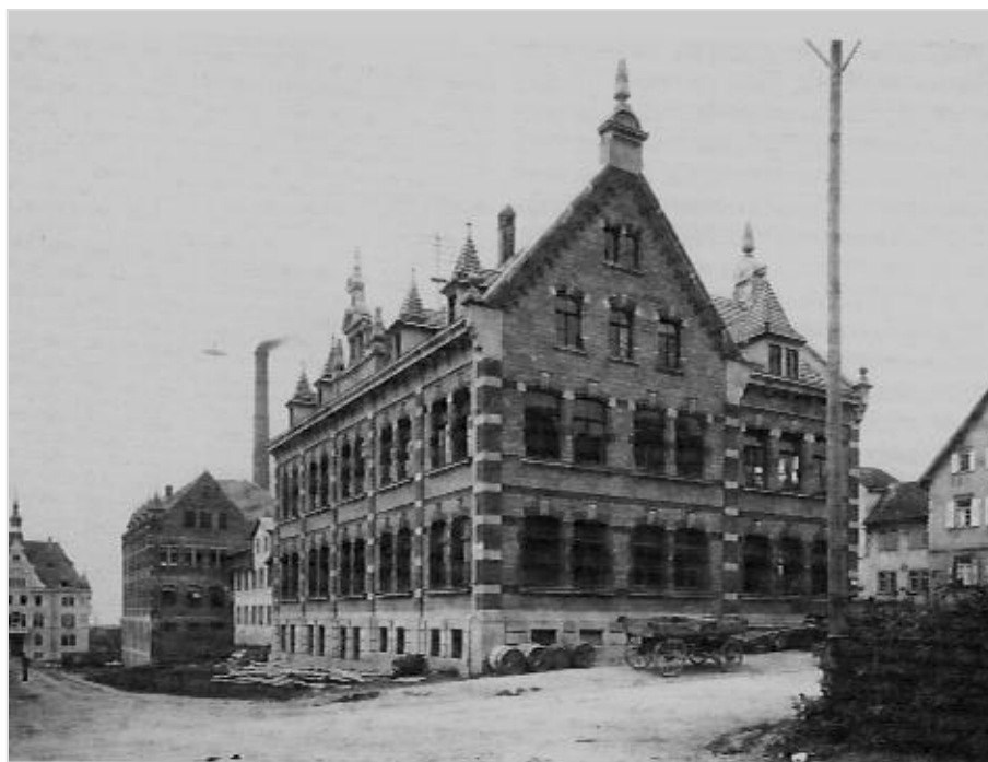
B 7: Die Hohner-Fabrik im Jahr 1904.

© Deutsches Harmonikamuseum aus: Häffner, Martin, Harmonicas .