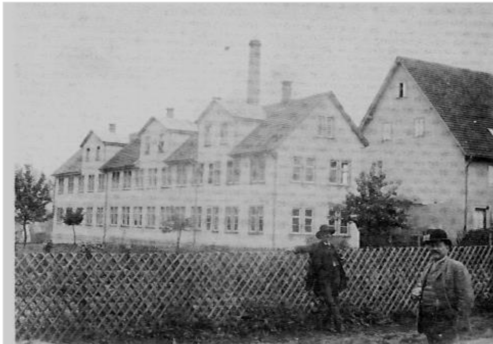
B 6: Erste Hohner-Fabrik wird Anfang der 1880er Jahre errichtet.

© Deutsches Harmonikamuseum aus: Häffner, Martin, Harmonicas . Die Geschichte der Branche in Bildern und Texten , Oberndorf 1991, S. 26