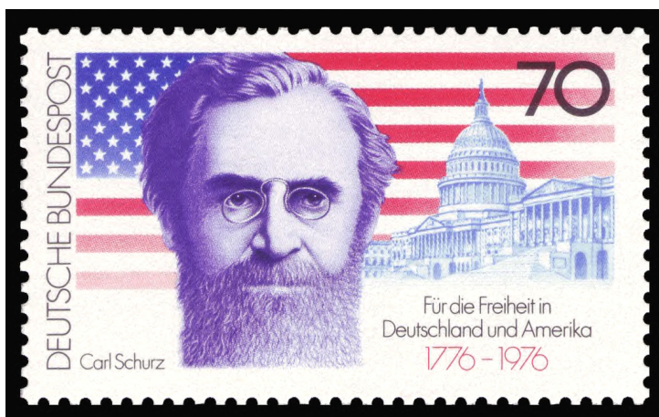
Die Deutsche Bundespost widmete Carl Schurz mehrere Briefmarken, so auch diese zum 200. Jahrestag der Unabhängigkeit der USA