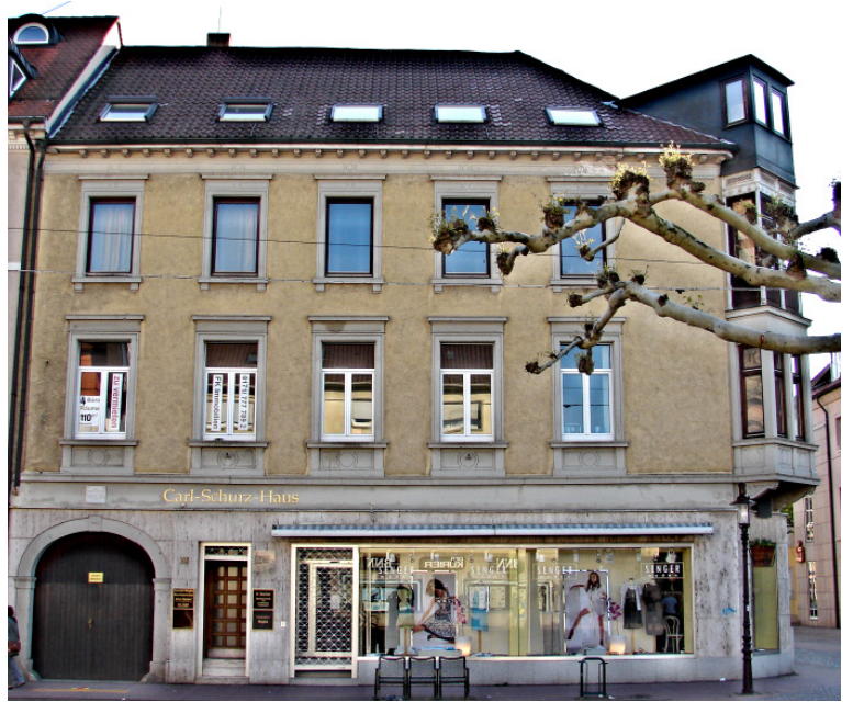
Hier lebte Carl Schurz während der Belagerung Rastatts.