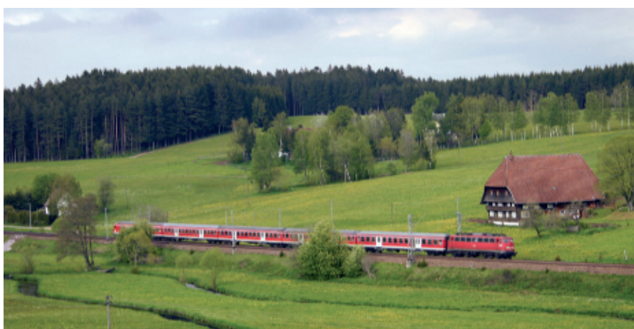
Zukunft und Vergangenheit: Seit Dezember 2006 verkehren auf der Schwarzwaldbahn neue Zugkonfigurationen, bestehend aus Doppelstockwagen und der E-Lok »BR 146.2« (oben). Züge wie der im unteren Bild zu erkennende »Interregio-Expreß« haben indes ausgedient. Die DB setzt sie künftig auf anderen Strecken ein.

auch schon in den »Kinderjahren« der Schwarzwaldbahn. Beispielsweise verbrachte der Großherzog aus Baden die Sommerfrische auf der Tannenhöhe bei Villingen. Dafür wurde