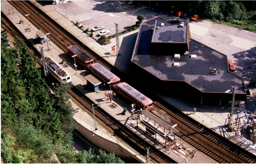
Triberg ist einer der Haltepunkte entlang der Schwarzwaldbahn. Dieses Foto zeigt von höherer Warte aus das neuzeitliche Bahnhofsgebäude und einen nostalgischen, aus drei Einheiten bestehenden Schienenbus. Ab Triberg beginnt dann der tunnelreichste Abschnitt der Schwarzwaldbahn hinauf nach St. Georgen.

gen und Loks nach der Auslieferung, während der temporären Verwendung im Test- und Inbetriebnahme? Die zweite wichtige Frage, die sich den Bahn-Verantwortlichen stellte: »Wo stellen wir die innerhalb kürzester Zeit frei werdenden Zugkompositionen ab?« Das Ganze mußte natürlich gelöst werden, ohne daß sich »Alt und Neu« – bei heutzutage beschränkten Gleis- und Weicheninfrastrukturen – in die Quere kommen durfte. Und es gab noch eine weitere logistische »Knacknuß«: Wo werden die in größeren einheitlichen Blöcken ankommenden Fahrzeugtypen (Loks aus Kassel, Doppelstocksteuerwagen A- und B aus Görlitz) zu den definitiven Kompositionen zusammengestellt? Das Team um Dirk Andres fand für dieses Problem die Lösung in Gengenbach am westlichen Fuß des Schwarzwaldes. So gab es unzählige Detailfragen abzuklären, infrastrukturell mußte unter anderem eine neue Außenreinigungsanlage in Freiburg (Investitionsvolumen: knapp fünf Millionen Euro) und eine neue Innenreinigungsanlage auf Schweizer Gebiet im »Konstanzer-Zwickel« zeitgerecht erstellt werden. Außerdem galt es, das Personal auf Loks, in den Wagen wie auch auf den Leitstellen mit den neuen Gegebenheiten vertraut zu machen.