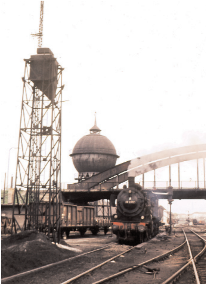
In den Anfangsjahren der Schwarzwaldbahn war Villingen der maschinen-technische Mittelpunkt, wie dieses Fotos eindrucksvoll dokumentiert. In der Bildmitte eine Dampflok, links daneben die Besandungsanlage und im Hintergrund der große Wasserbehälter.