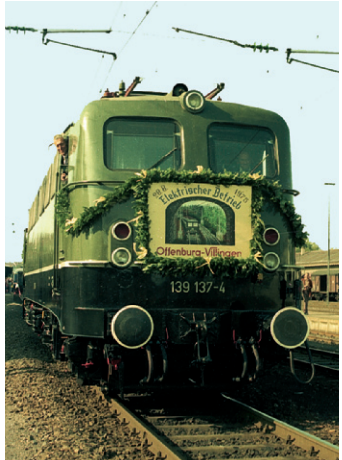
Ein Meilenstein bedeutete für die Schwarzwaldbahn die in den 70er Jahren begonnene Elektrifizierung. Veranschlagt waren anfangs 40, am Ende kostete die Elektrifizierung zwischen Offenburg und Villingen 100 Millionen Mark.

der Bau der gesamten Bahnstrecke von Offenburg bis zum Bodensee. Davon entfielen allein