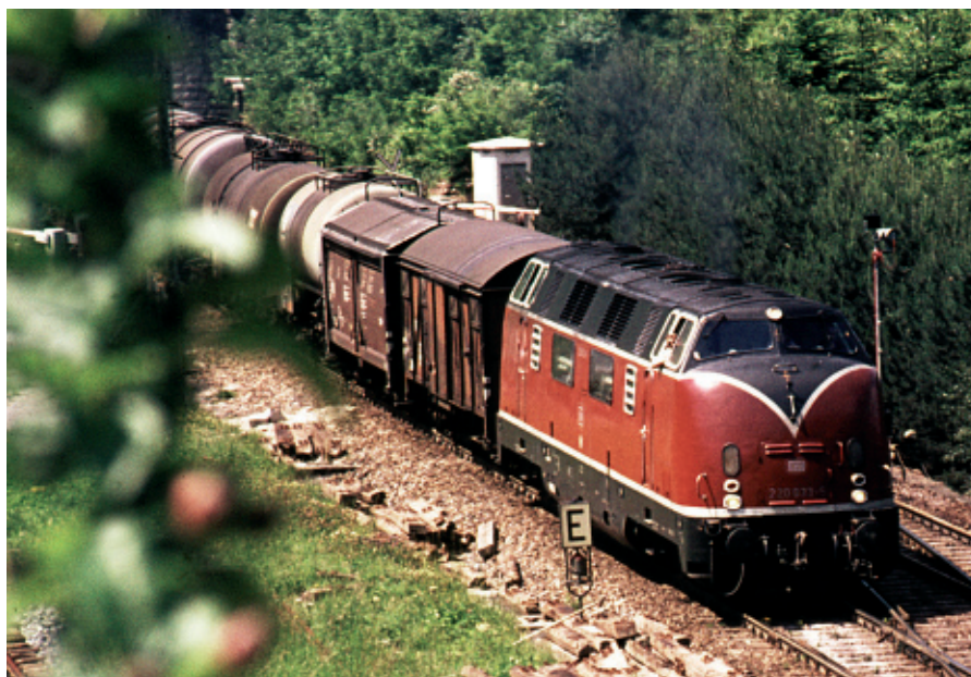
Der Güterverkehr spielte auf der Schwarzwaldbahn früher eine wesentlich bedeutendere Rolle als heute. Den PS-starken Dieselloks vom Typ »V 200«, die lange Zeit das Bild der Schwarzwaldbahn prägten, wurde auf der Fahrt durch den Schwarzwald einiges abverlangt.

Diese ist nun vor eine große Herausforderung gestellt: Es blieben gerade mal 34 Monate, um komplett neues Rollmaterial zu bestellen, den Detailfahrplan auszuarbeiten und vor allem,