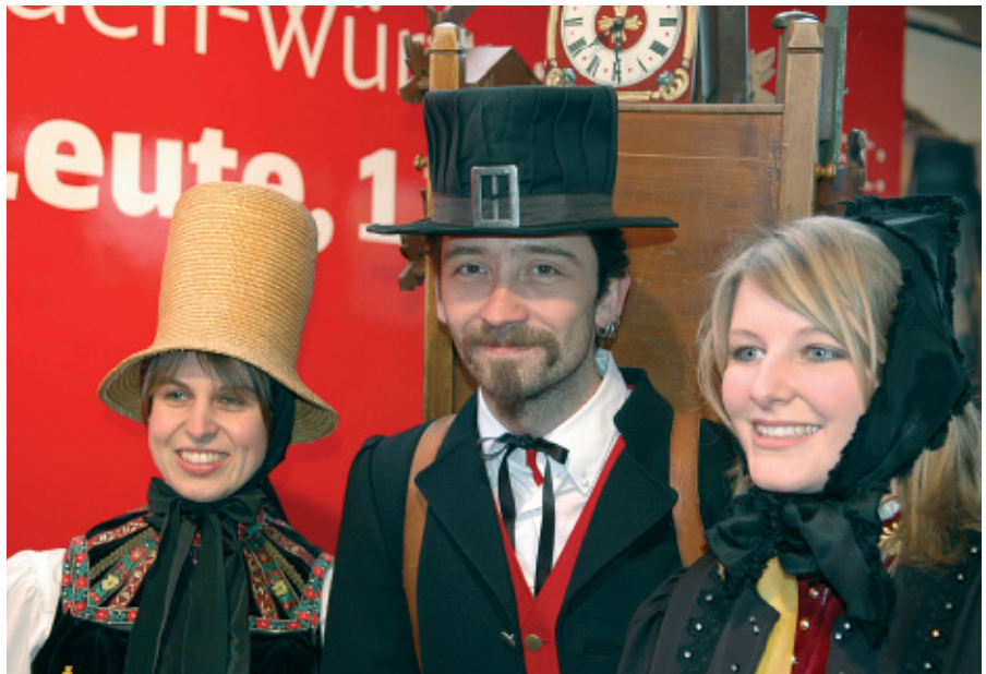
Ein Foto, das nun mal zum Schwarzwald gehört. Bei den Festlichkeiten anlässlich der Eröffnung der Neuen Schwarzwaldbahn durften hübsche Trachtenträgerinnen ebenso wenig fehlen, wie der obligatorische Uhrenträger.

Dirk Andres: »In einem ersten Schritt wollen wir die systematischere und bedarfsgerechtere