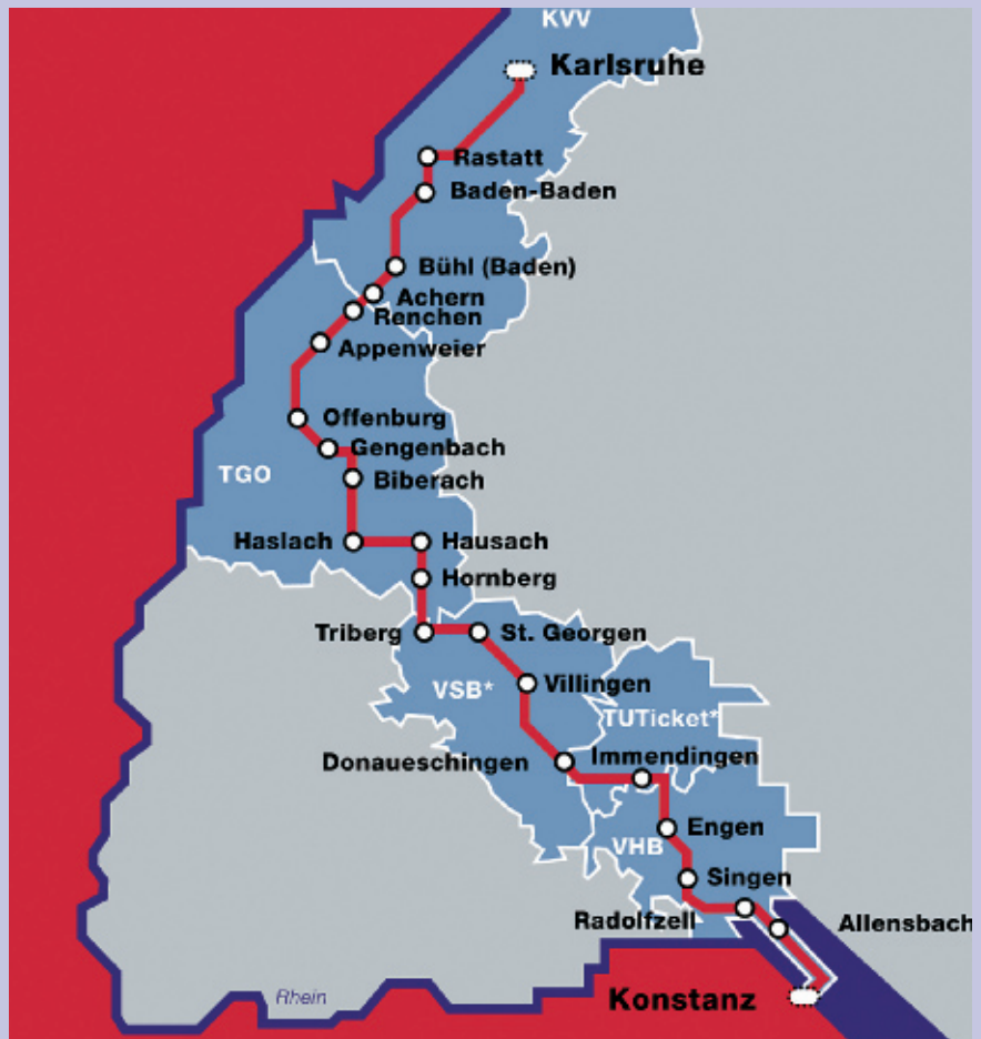
Durch das Gebiet von fünf Verkehrsverbünden führt die 252 Kilometer lange Strecke der Schwarzwaldbahn von Karlsruhe nach Konstanz (siehe Karte). Sie erschließt dabei ein Gebiet, in dem mehr als vier Millionen Menschen leben.

So steigen wir – um eine heutige Fahrt im Düsenteppich zu simulieren – in ruhigen Gefilden, nämlich in Konstanz (einzelne Züge fahren ab/bis Kreuzlingen) in den Doppelstockzug der Schwarzwaldbahn ein. Zunächst geht es entlang dem Bodensee nach Radolfzell und