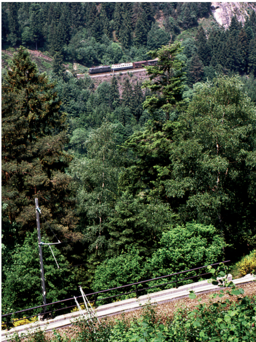
Die Überwindung von 448 Höhenmetern – soviel beträgt die Differenz zwischen Hornberg (384 m.ü. NN) und Sommerau auf dem Scheitelpunkt (832 m.ü. NN) – bedeutete für die Schwarzwaldbahn-Erbauer damals eine schier unvorstellbare Herausforderung. Wer heutzutage auf der Schwarzwaldbahn fährt und zeitweise die grandiosen Ausblicke genießen kann, kann nur erahnen, mit welchen Problemen Gerwigs Leute damals zu kämpfen hatten.

Ganz im Schatten der Schwarzwald-Überquerung steht die Überwindung der Wasserscheide Donau-Rhein, dem südlichen Ausläufer der Schwäbischen Alb; auf dem östlichen Teil der Schwarzwaldbahn also. Wer heute von Singen via Engen Richtung Tuttlingen–Stuttgart und natürlich auch Richtung Schwarzwald–Karlsruhe fährt, mag wenig davon merken, ragt doch keine Bergspitze markant über die hügelige Landschaft hinaus. Und die Züge gewinnen in