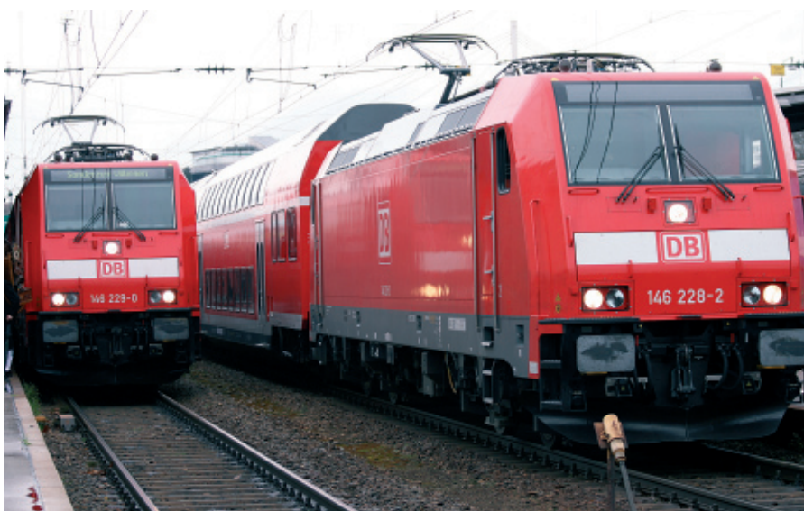
Die neuen Doppelstock-Kombinationen werden von bärenstarken Loks des Typs »BR 146.2« gezogen. Die E-Loks bringen eine Nennleistung von 7600 PS auf die Schiene, das Gewicht beträgt 84 Tonnen.

den ganzen Betrieb pünktlich zum Fahrplanwechsel am 10. Dezember 2006 aufzugleisen (siehe auch Interview mit Dirk Andres).