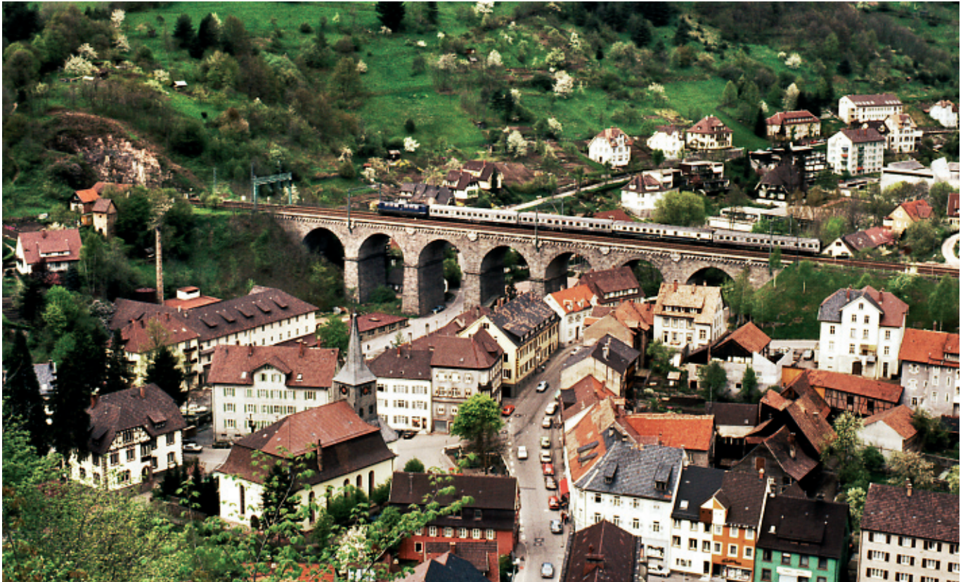
Eines der imposantesten Bauwerke auf der Trasse der Schwarzwaldbahn ist zweifellos der Reichenbachviadukt bei Hornberg. Die ursprüngliche Brücke erwies sich indes als zu schwach, worauf in nur 17 Monaten Bauzeit eine ästhetisch wundervolle Konstruktion mit sieben Bogen hochgezogen wurde.

Sanft und laufruhig schlängelt sich die »große Rote« durch den Schwarzwald. Staunend gucken selbst Einheimische immer wieder in die sich permanent ändernde Kulisse des größten Mittelgebirges Deutschlands. Seit 10. Dezember 2006 bietet die Schwarzwaldbahn mit brandneuen Doppelstockwagen und einer superstarken Lok der Baureihe 146 ein attraktives Angebot im Stundentakt zwischen Konstanz und Karlsruhe an. Daß die Bahn genau dort durchfährt, wo sie heute fährt und so komfortabel wie nie zuvor, ist freilich alles andere als selbstverständlich (mehr dazu in »Pech für die Schatulle – Glück für die Touristen«).