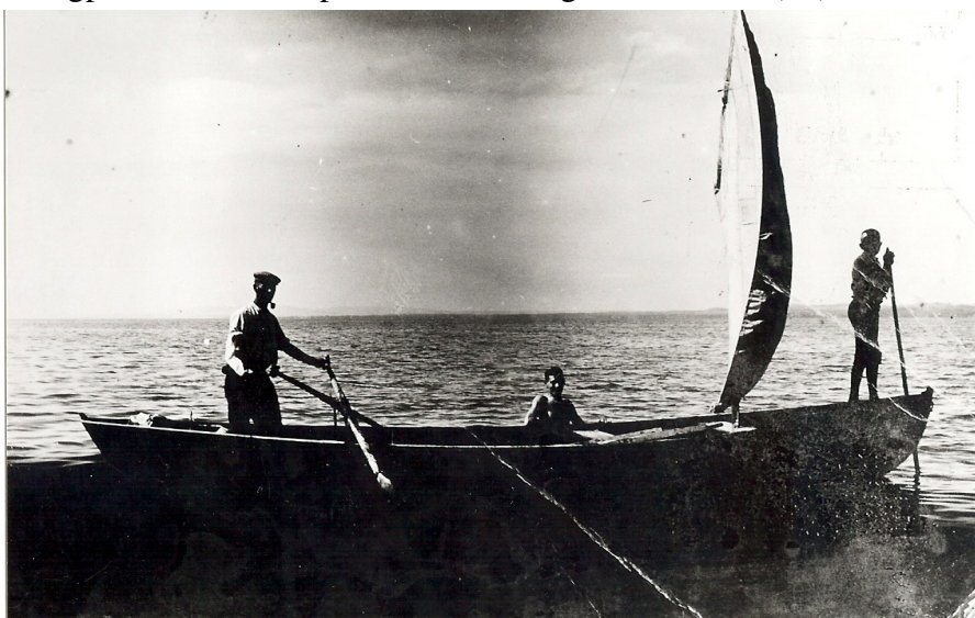
Abbildung 6 (B 44): Eint typisches Berufsfischerboot des Obersees. Bis zu 25km mussten die Fischer zu den Fanggebieten vor Bregenz rudern. Mit Glück konnte man sich an Lastkähne anhängen – oder hatte guten Rückenwind.

Hatte man bei dem ersten Fang des Tages Erfolg, so pirschten sich die Berufskollegen heran, die mit Ferngläsern alles beobachtet hatten - ein Fangplatz war entdeckt. War bei dem ersten Netzauswurf nichts, gefangen worden, auch von den Nachbarn nichts, so fuhr man weiter in eine andere Himmelsrichtung, Wind und Wetterstimmung, auch Strömung sowie Wasserfarbe (Belichtung) sind wesentliche Punkte, die der Chef mit dem ersten Garnzieher bespricht. Oft geht die gute Fangzeit den ganzen Tag bei Stellungswechsel, und mit Ruderbetrieb konnte eine tüchtige Mannschaft 30 bis 35 mal am Tag das Netz auswerfen. Ein Fang mit Auswurf und Einzug der Netze dauerte etwa 15 Minuten. So kam es oft vor, dass sich die Fischerei bis gegen die Mittagszeit zur Zufriedenheit vollzogen hatte. Da der Nachmittag oft stärkere Strömung, auch ungünstigen Wind für Zugnetzscherei mit sich brachte, so wurde oft "an Land gefischt" in der Gastronomie, die Alten unter sich, die Stifte oft beisammen bei der Kegelbahn. Um die Abendzeit ging es nochmals auf die Fangplätze, dann in später Dämmerung nach Hause. (...)