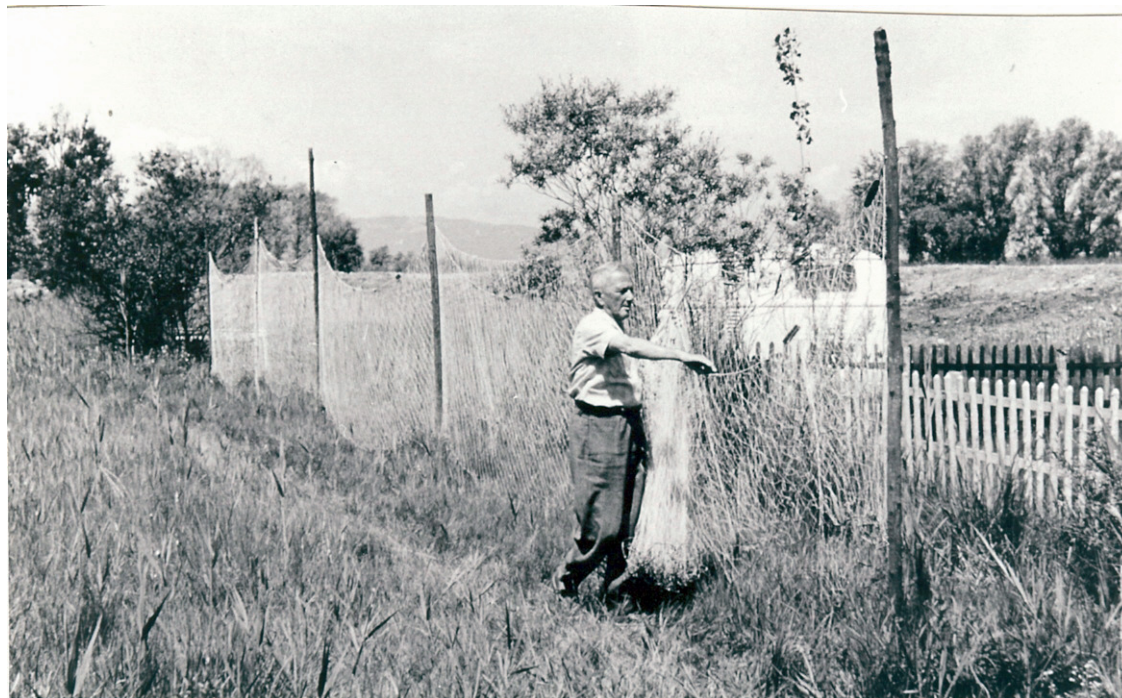
Abbildung 8 (B 46): Hanf- und Baumwollnetze mussten nach dem Einsatz getrocknet werden.

Inzwischen hatten wir uns vom handgestrickten Zugnetz auf maschinengestrickte Baumwollnetze umgestellt, was den Fischfang nur begünstigte. Hanfnetze hatten wir bisher selbst von Hand angefertigt. Die Fischerfrauen hatten einen besonderen Stolz, uns einen langfaserigen, selbst gepflanzten und gesponnenen Hanf überreichen zu können. Der Preis für eine Fischerei-Netz-Garnitur in Baumwolle betrug etwa 120 RM, später über 200 RM. Die Umstellung von den Schwebenetzen auf die baumwollenen Zugnetze brachte höhere Fangerträge an Blaufelchen. Wir vom Überlinger versuchten unsere Fanggebiete immer weiter gegen das Rheingebiet bei Rorschach und gegenüber bis Nonnenhorn, Bad Schachen auszuweiten. (...)