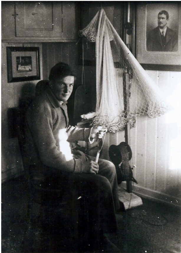
Abbildung 7 (B 45): Fischer haben keinen Feierabend. Löcher in Netzen müssen ständig ausgebessert werden, damit die Fische nicht hindurchschlüpfen.

Eine Umstellung in unserem Beruf hatte bereits begonnen in der Weise, dass statt vier Mann in einem großen Fischerkahn nur noch zwei Mann, möglichst Vater und Sohn oder Partner mit je einem Fischer-Patent, zusammen in einem einfachen Ruderboot arbeiteten. Die Arbeit wurde hierdurch nicht erleichtert, jedoch blieb dem Fischermeister der Ärger mit den Fischergehilfen erspart und die Auslagen wurden geringer. Mit 18 Jahren waren meine Kräfte ausreichend für dieses Zwei-Mann-System mit Vater und Sohn. Ein neues kleines Ruderboot von etwa 6 m Länge und 1,30m Breite wurde von der Bootswerft Beck 1 auf der Reichenau gekauft. Während ein Mann ruderte, war der andere beim Netzauslegen beschäftigt. Bei größerer Fahrt gab es 2