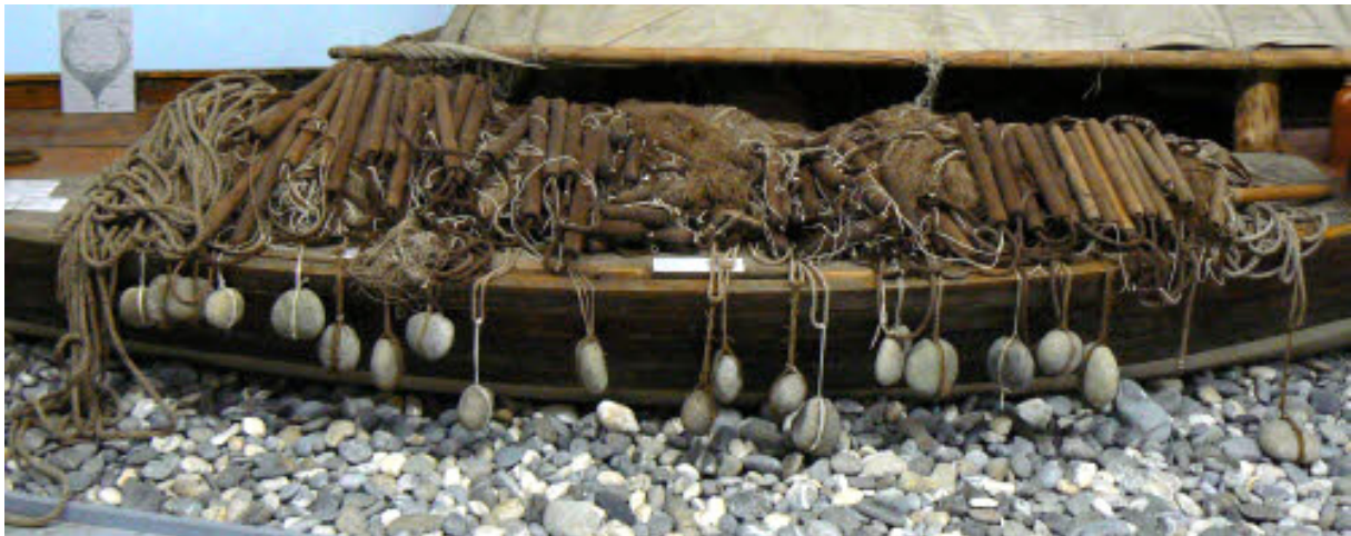
Abbildung 9 (B 47): Typisches Klusegarn mit Steinen, damit der untere Netzrand schnell nach unten sinkt und Hölzern, damit der obere Rand an der Oberfläche schwimmt.

Immer wieder tauchten Fischer auf von irgendeinem Fischerdorf, die sich einen Motor angeschafft hatten und uns damit auch zum Obersee mitnahmen. So konnte man 1913 bereits 20 - 30 Fischerboote zählen, die einen Benzin-Motor von der Bodanwerft hatten. Waren wir mit der altmodischen Ruderei an einem Fangplatz eingetroffen, stellten wir fest, dass die motorisierten Fischer bereits 1 - 2 Körbe voll (etwa 200 Stück) Fische eingeheimst hatten. So sagten wir uns im Sommer 1913: im nächsten Jahr wird die Fischerei mit einem Motorboot und Zuggarn betrieben. In Unteruhldingen hat ein begabter älterer Fischer sich zusammen mit einem Wagner schon 1913 ein Boot von 9 m Länge und 1,40 m Breite gebaut und einen Benzin-Motor mit 6 PS eingesetzt. Ein solches sollte der gute Berufskollege mit der Einwilligung unserer Finanzspender und CheFs auch bauen um den Preis von 300 RM. Durch Ratenzahlung konnten wir einen Benzin-Motor bei der Bodanwerft erstehen und für den Gesamtpreis von 1.200 RM einbauen lassen. (1914 starb die Mutter Josef Sulgers. Er wurde auf dem See vor der Schweiz davon informiert und ruderte zusammen mit seinem Bruder 25km nach Hause. Anm. v. C. Arbeiter)