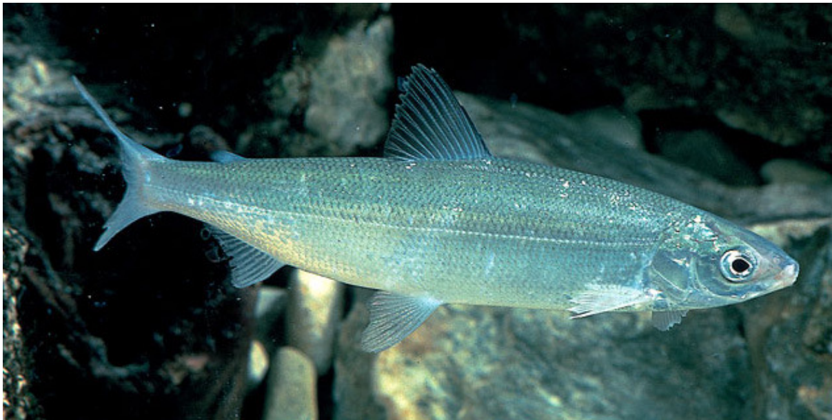
Abbildung 4 (B 26): Der Blaufelchen ist seit dem 19. Jahrhundert der wichtigste 'Brotfisch' der Berufsfischer am Bodensee-Obersee. Im Untersee werden vor allem Sandfelchen gefangen.

Wenn auch in unserem freien Fischerberuf damals noch keine besonderen Prüfungen und Lehrgänge stattfanden, so war doch sehr vieles zu lernen. Zunächst das Rudern im Takt zu Dreien auf Kommando: "Hoh Ruck 1-2 +1-2". Im Dreiersystem bestand die Mannschaft aus: dem Garnzieher auf der sogenannten Schraube, wo das Schiff in der Mitte von 1,50 m Breite zusammenschraubt war, dann dem Schwebezieher, dem zweiten Gehilfen, und oben auf der Spitze, dem sogenannten Gras, saß der Stift. Der Chef oder Meister stand zu seinem Steh- oder Druckruder, bestimmte durch sein etwas mehr oder weniger die Fahrtrichtung zum Fangplatz, der oft von Tag zu Tag wechselte.