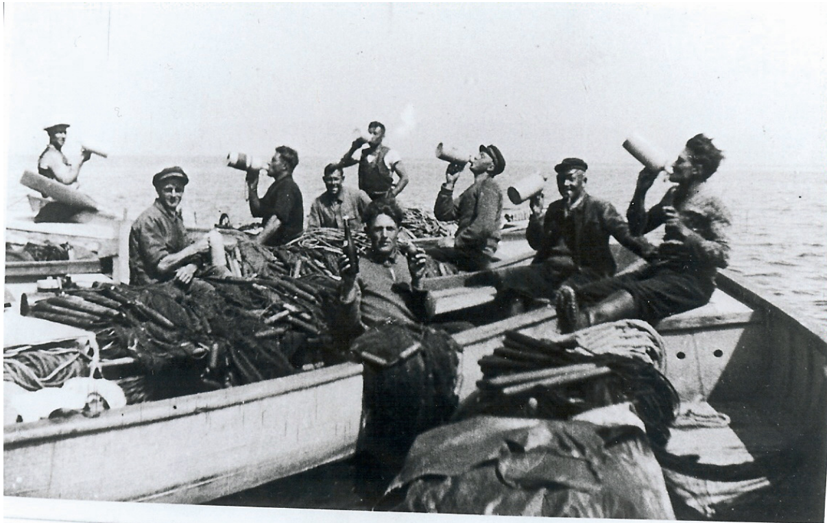
Abbildung 3 (B 42): Wer hart arbeitet, kriegt Durst.... Obersee-Berufsfischer beim Vesper.

Ohne kleinen Nebenbetrieb, kleiner Landwirtschaft oder dergleichen, bestand hier im Überlinger Seegebiet selten ein Fischer. In Abwesenheit des Hausvaters, der mit seinen drei weiteren Mitarbeitern oft spät nach Hause kam, übernahm die Hausmutter das Kommando über die landwirtschaftlichen Arbeiten. Ganz langsam, doch immerhin ohne Zwang, erkannte ich die Notwendigkeit zur Mithilfe in den vielerlei Arbeiten der Landwirtschaft. (...)