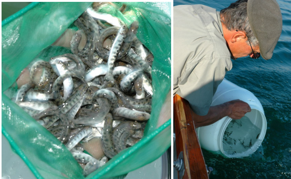
Abbildungen 5 und 6 (B 63 & 64): Junge, vorgestreckte Saiblinge werden im Bodensee ausgesetzt. Schon mit zwei Jahren haben sie eine Länge von über 30cm.