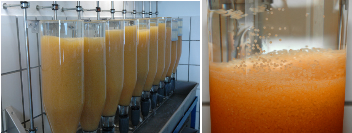
Abbildungen 1 und 2 (B 59 & 60): In diesen Zugergläsern werden die befruchteten Eier ausgebrütet. Dazu werden sie ständig von sauerstoffreichem Seewasser umspült.