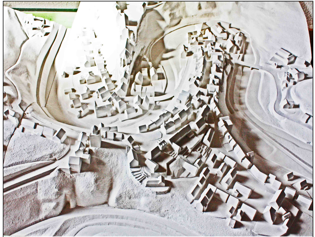
PES-Modell: Gerold Bucher, Haigerloch, Photo: Markus Fiederer 2009