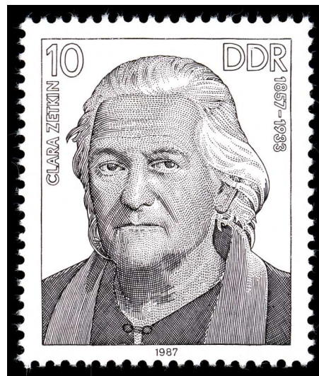
B37 Clara-Zetkin-Briefmarke der DDR