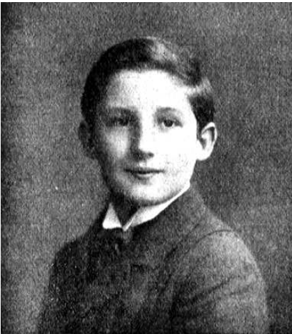
1909 im Alter von 12 Jahren