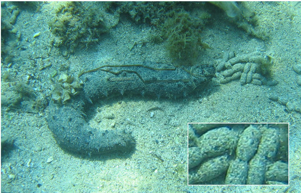
Abb. 1: Röhrenseegurke mit Kotwürsten (Ausschnittsvergrößerung: Kotwurst)

Sie fällt jedem Schnorchelanfänger auf und ist leicht einer Tiergruppe zuzuordnen: Die dunkle Wurst am Meeresgrund ist eine Seegurke. Es handelt sich im Mittelmeer in den allermeisten Fällen um die Art Holothuria tubulosa (Röhrenseegurke; s. Abbildung 1). Bei genauerem Hinsehen entdeckt man am Hinterende der Tiere nicht selten die Kotwürste der Tiere (s. Abbildung 1). Damit verbinden wir etwas Unangenehmes und Stinkendes. Nicht so in diesem Fall. Die Kotwurst entpuppt sich als Ansammlung von Sandkörnern, die in eine dünne durchsichtige Membran eingehüllt sind. Fressen Seegurken etwa Sand? Kann man davon leben? Wie funktioniert ihre Ernährungsweise?