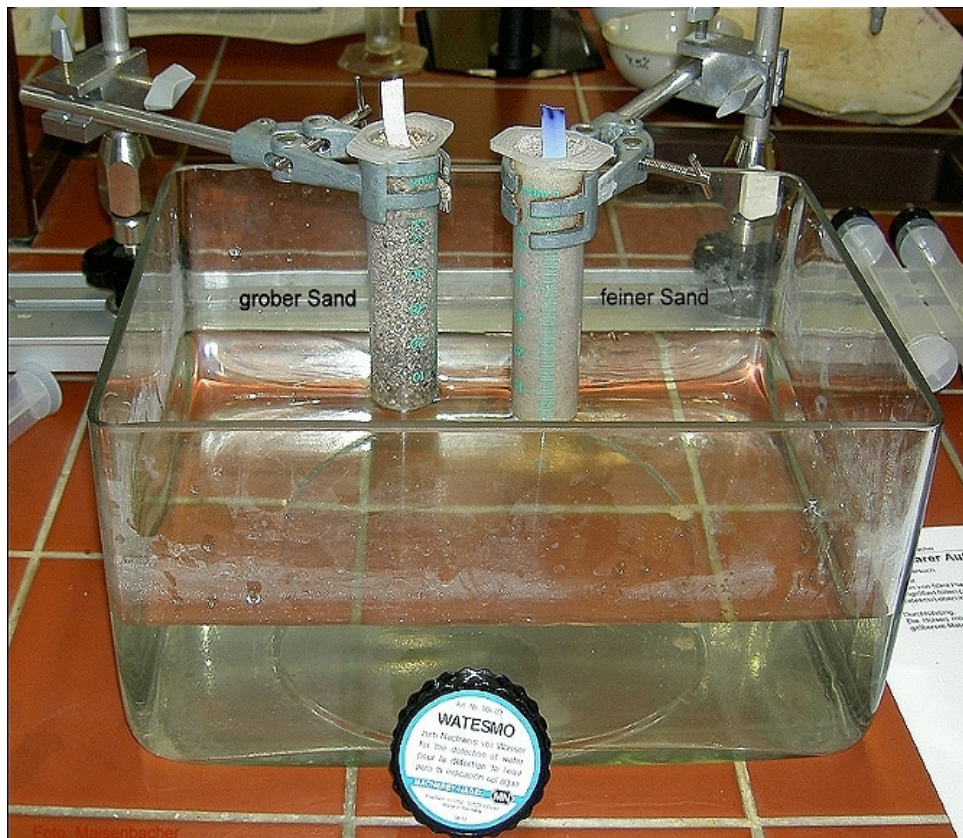
Versuchsaufbau und Ergebnis

Alternative zum Wasser und Wassernachweispapier: Gefärbtes Wasser: z.B. roter Beete – Saft, o.Ä.