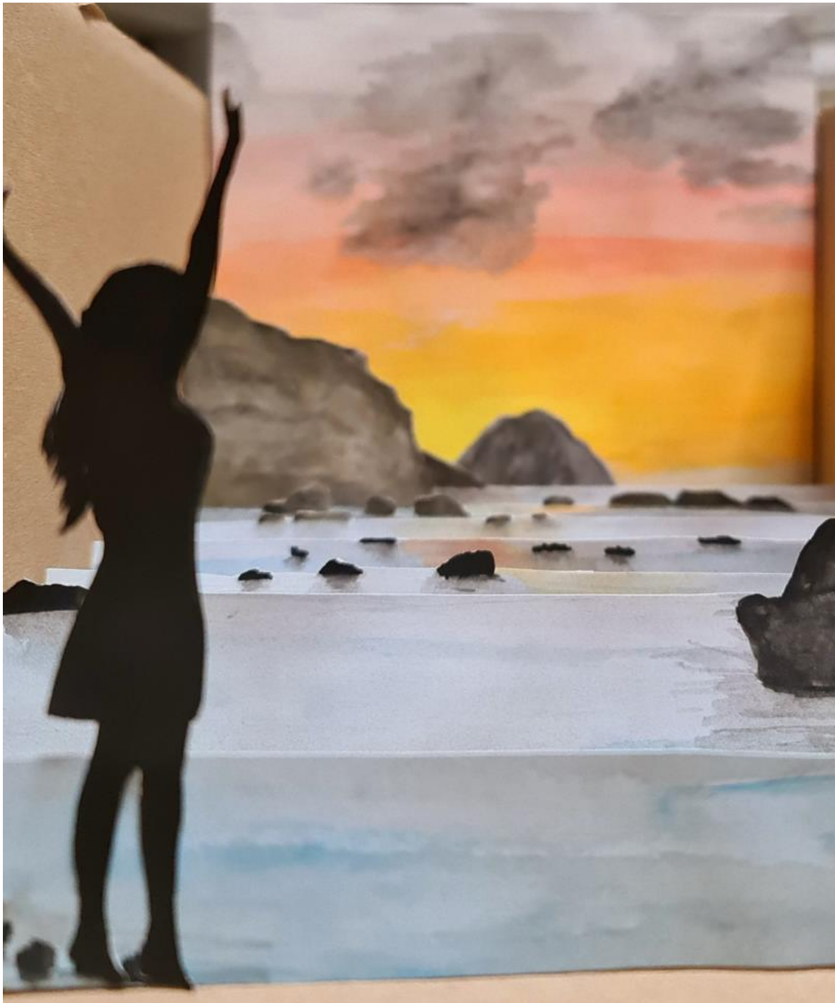
Arbeiten von Schülerinnen und Schülern des FSG-Fellbach