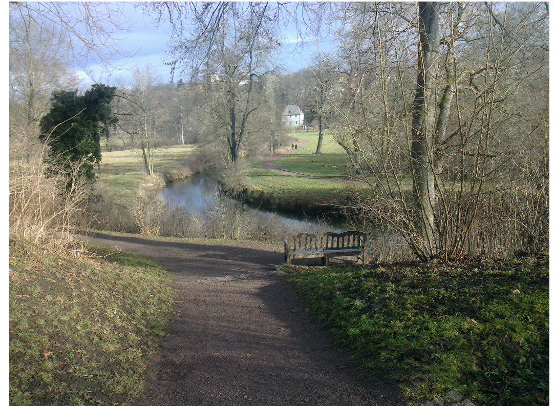
Park an der Ilm in Weimar, zwischen 1778 und 1792 durch Goethe und Herzog Carl August geplant.