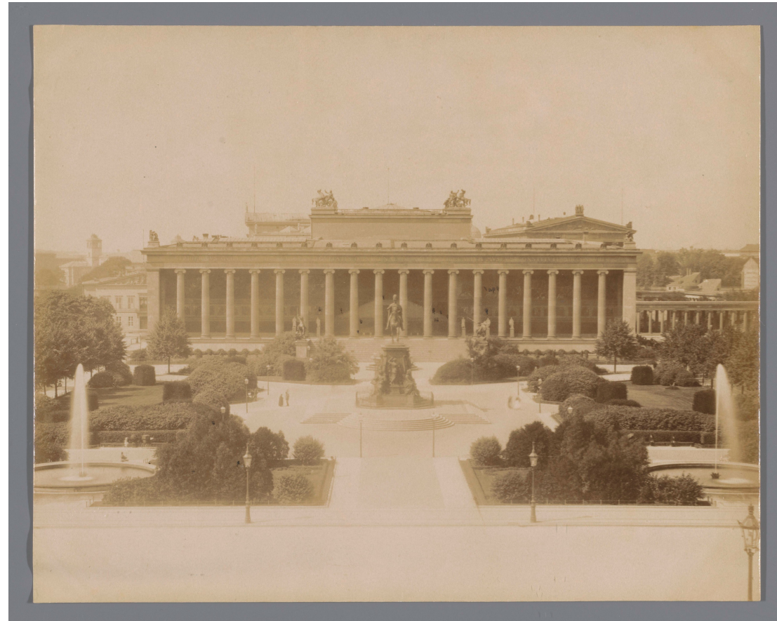
Altes Museum in Berlin

Karl Friedrich Schinkel (1824-1830 erbaut)