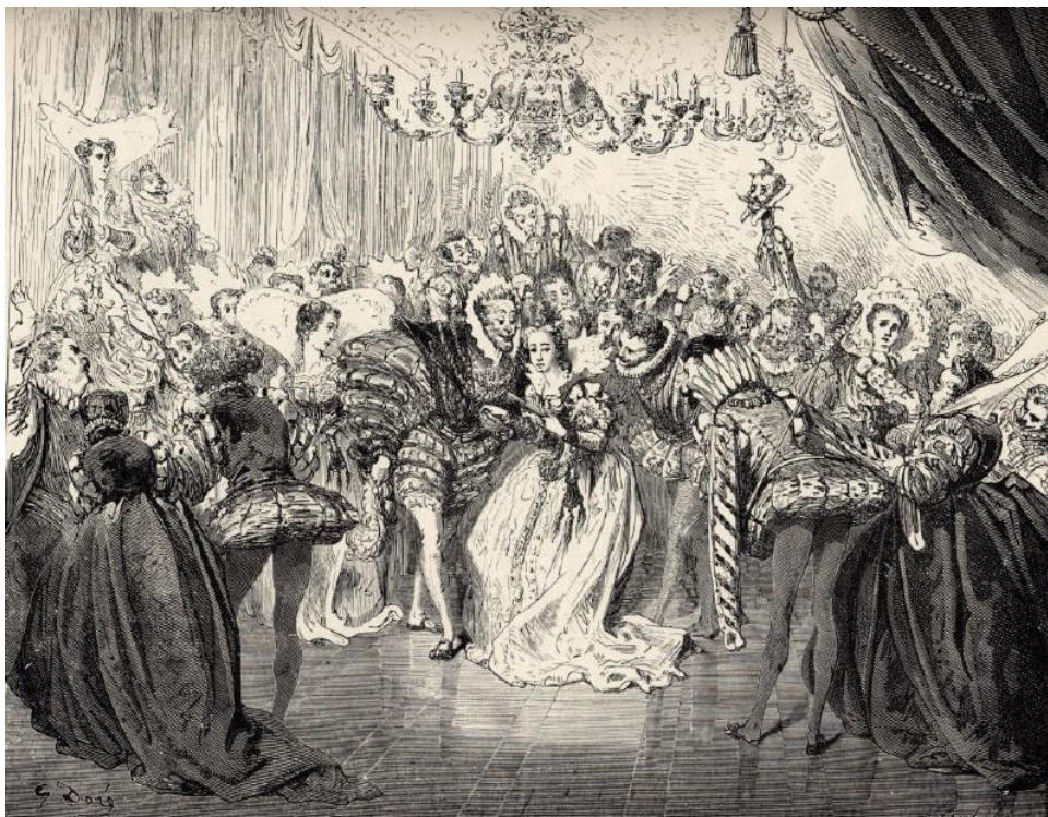
Gustave Doré, Cendrillon , in : Les Contes de Perrault , Hetzel, Paris 1867

Le lendemain, les deux sœurs furent au bal, et Cendrillon aussi, mais encore plus parée que la première fois. La jeune demoiselle ne s'ennuyait point et oublia ce que sa marraine lui avait recommandé ; de sorte qu'elle entendit sonner le premier coup de minuit, lorsqu'elle ne croyait point qu'il fût encore onze heures ; elle se leva, et s'enfuit aussi légèrement qu'aurait fait une biche 65 . Le prince la suivit. Elle laissa tomber une de ses pantoufles de verre, que le prince ramassa bien soigneusement. Cendrillon arriva chez elle, bien essoufflée 66 , sans carrosse, sans laquais, et avec ses méchants habits ; rien ne lui étant resté de sa magnificence, qu'une de ses petites pantoufles, la pareille de celle qu'elle avait laissée tomber. On demanda aux gardes de la porte du palais s'ils n'avaient point vu sortir une princesse : ils dirent qu'ils n'avaient vu sortir personne qu'une jeune fille fort mal vêtue, et qui avait plus l'air d'une paysanne que d'une demoiselle.