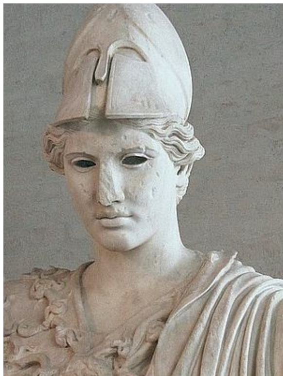
Abbildung: Athene, Typ Velletri. Standort: Glyptothek München.

Im trojanischen Krieg steht Athene auf der Seite der Griechen; sie ist es, die den Zorn des Achill, eigentliches Thema von Homers Ilias, beschwichtigt.