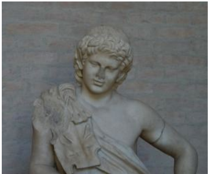
Abbildung: Statue des Bacchus mit dem Leopardfell, Glyptothek München.

Die ludi Cereales und die Liberalia waren zwei Feste, bei denen der Gott verehrt wurde. Man kann sie sich als Weinfeste mit religiösen Gehalten vorstellen.