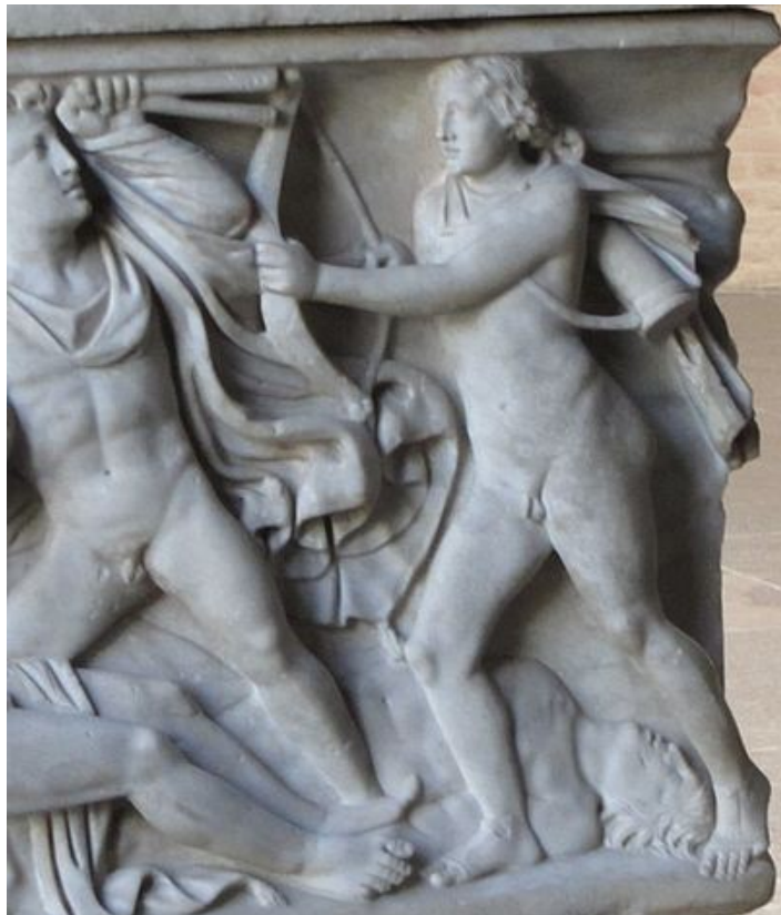
Abbildung: Ausschnitt aus dem Niobidensarkophag (Glyptothek München). Das Reliefbild zeigt die Ermordung der Kinder der Niobe, die sich gerühmt hatte, weil sie mehr Kinder als Leto, die Mutter von

Apoll und Diana, verspottete, dass sie selbst zwölf Kinder, Leto aber nur zwei habe, da erschossen Apoll und Diana alle ihre Kinder. Das lesen wir in dem Epos Metamorphosen des römischen Dichters Ovid, und es wird auch in der Kunst der Antike oft dargestellt. Rechts sieht man ein Bild von dieser Mordtat.