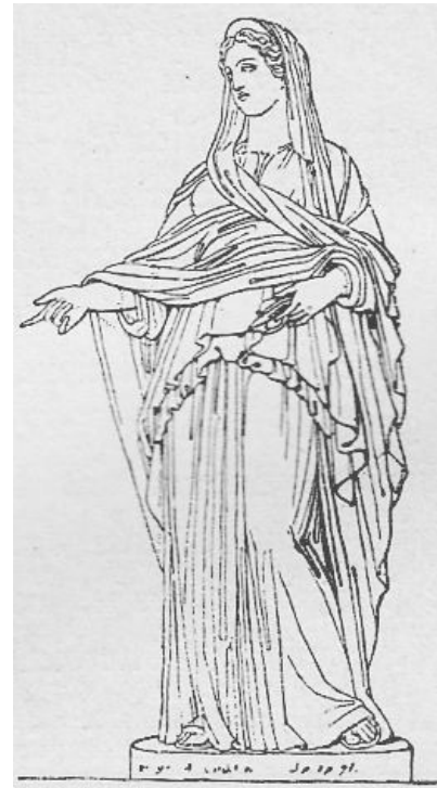
Abbildung: Ceres, die Göttin der Ernte und des Getreides. Die Abbildung ist aus diesem Buch entnommen: Oscar Jäger, Geschichte der Römer, Gütersloh 1896.