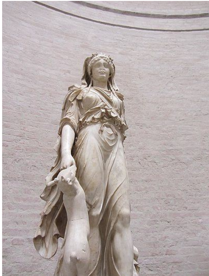
Abbildung: Diana, die Göttin der Jagd. Standort der Statue: Glyptothek München. Diese römische Statue aus dem 1. Jh. n. Chr. zeigt Diana mit Krone und Bogen, der jedoch nicht erhalten ist. Mit der rechten Hand umfasst sie die Vorderläufe eines Hirschkalbs.