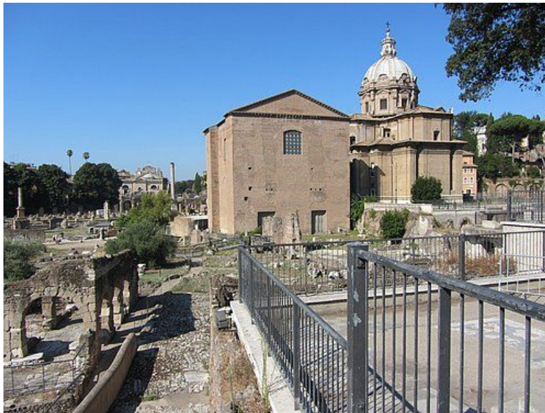
Das spätantike Gebäude der Curia auf dem Forum Romanum.

cūria , cūriae, f.: die Kurie, das Rathaus, die Senatsversammlung