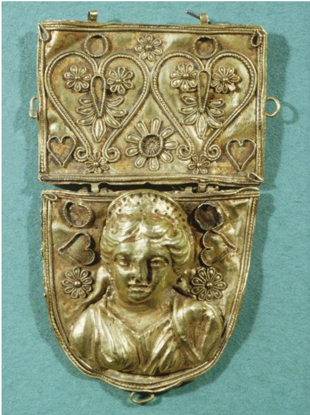
Goldornament mit Ziselierarbeit, Walters Museum, 3. Jh. v. Chr., Griechenland

URL: http://art.thewalters.org/detail/32464 , CC-Lizenz: CC0 ( Information beim Museum – CC-Lizenz )