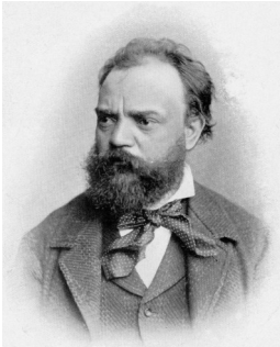
Photo von Antonín Dvořák veröffentlicht um 1900 [abgerufen am 11.07.2025]