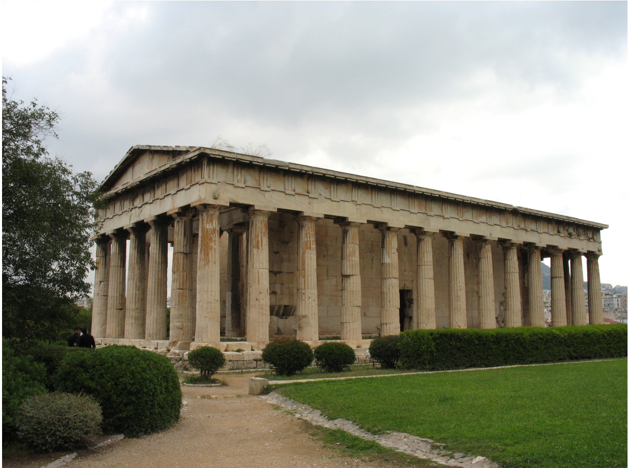
Der Hephaistos-Tempel in Athen

aus dem Jahr 1896. Sucht nun heraus, welche der abgebildeten Parlamentsgebäude die antiken Bauformen aufnehmen, und recherchiert, wieso die Architekten bzw. ihre Auftraggeber gerade antike Bauformen bevorzugt haben. Die Anmerkungen zur römischen Curia geben einen Hinweis auf eine mögliche Antwort.