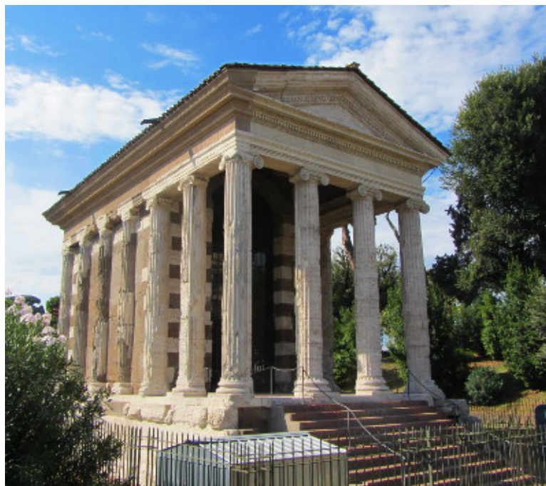
Der Portumnus-Tempel in Rom